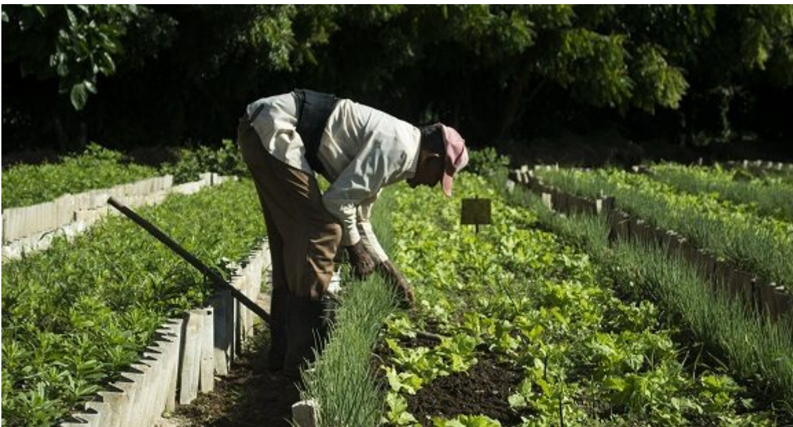
Agricultura urbana en Cuba.

Los Polos funcionan como encadenamientos mediante contratación entre los actores económicos que intervienen en su desarrollo y sus principales funciones consisten en: