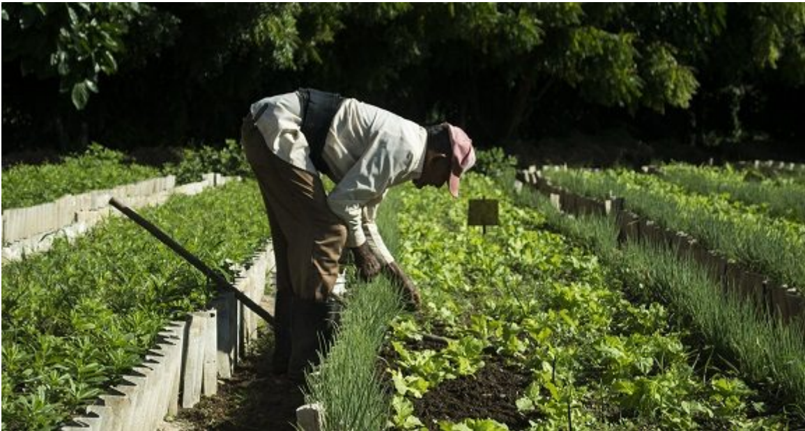
Agricultura urbana en Cuba.

Los Polos funcionan como encadenamientos mediante contratación entre los actores económicos que intervienen en su desarrollo y sus principales funciones consisten en: