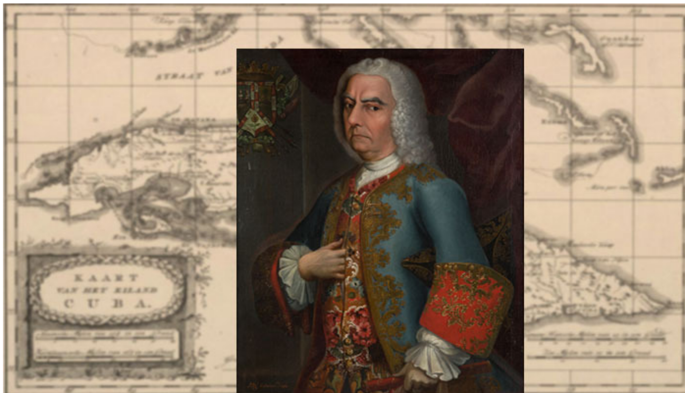
Juan Francisco Güemes de Horcasitas