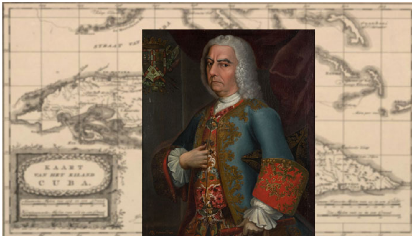
Juan Francisco Güemes de Horcasitas