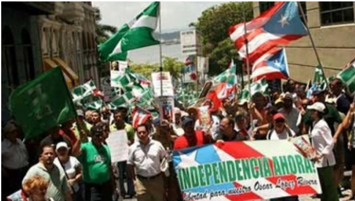
Marcha reclama descolonización de Puerto Rico

Otras organizaciones que participaron en la marcha fueron la Alianza Pro Libre Asociación Soberana (ALAS), el Movimiento Unión Soberanista (MUS), Boricuas Unidos en la Diáspora, el Frente Puertorriqueño, Diálogo Soberanista y el Partido Revolucionario de Trabajadores Puertorriqueños (PRTP-Macheteros).