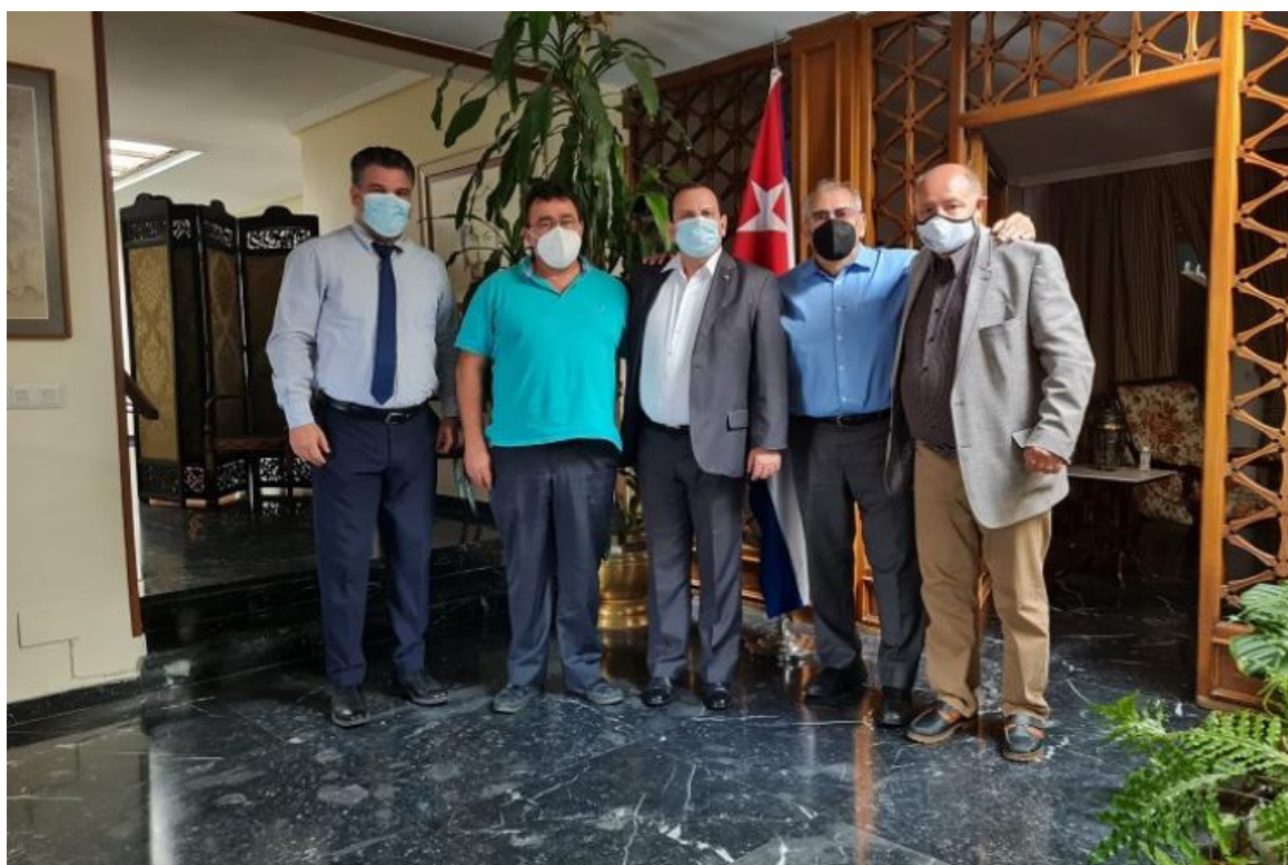
Sostiene Fernando González Llort encuentros con líderes partidistas y sindicales de España.

Madrid, 22 sep (RHC) La condena al bloqueo de Estados Unidos contra Cuba y las muestras de solidaridad, se destacaron durante la segunda jornada de visita del presidente del Instituto Cubano de Amistad con los Pueblos (ICAP), Fernando González Llort a España.