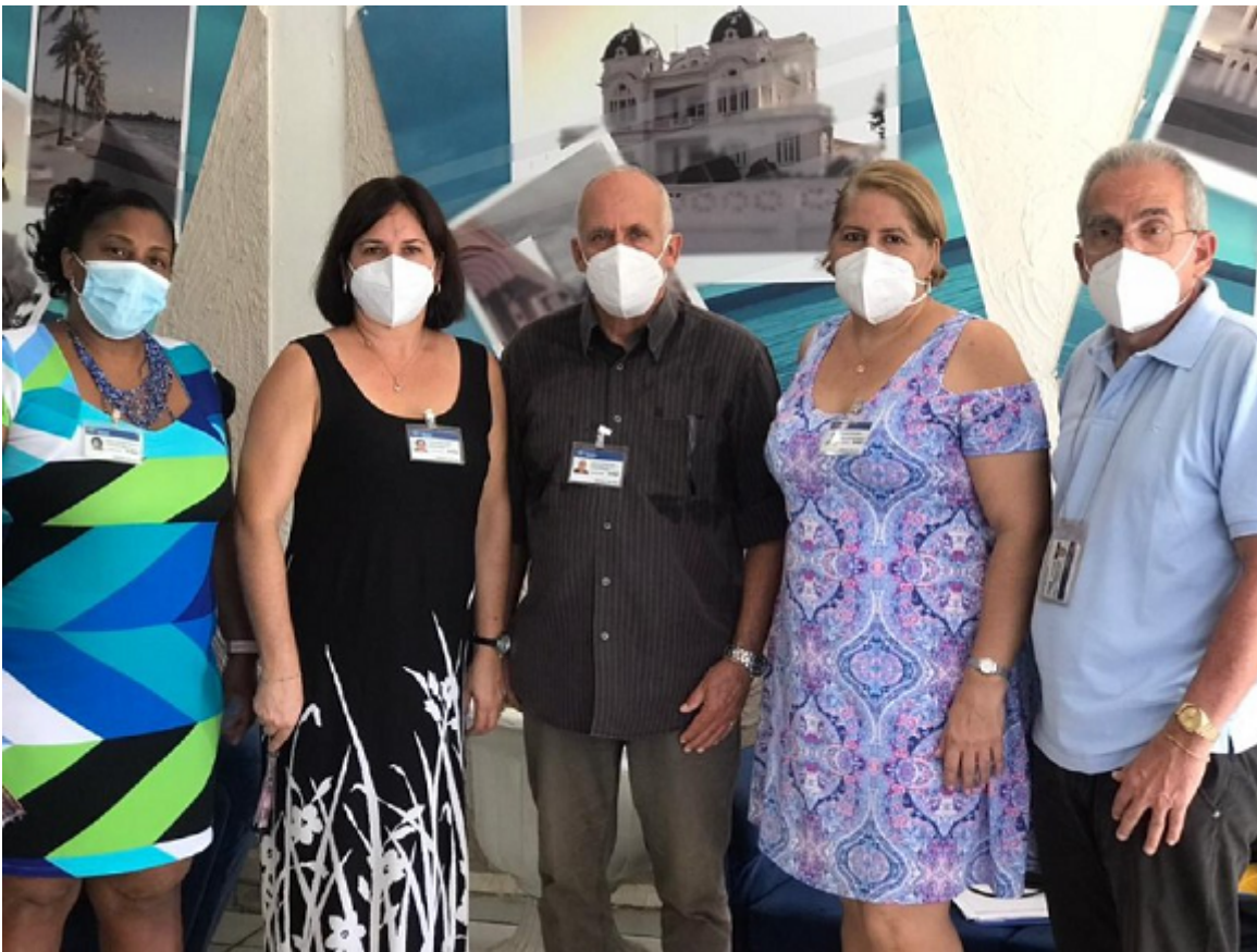
El equipo de inspectores del CECMED que realizó las inspecciones a los sitios clínicos en Cienfuegos y desde allí culminaron el proceso de evaluación de esta vacuna.