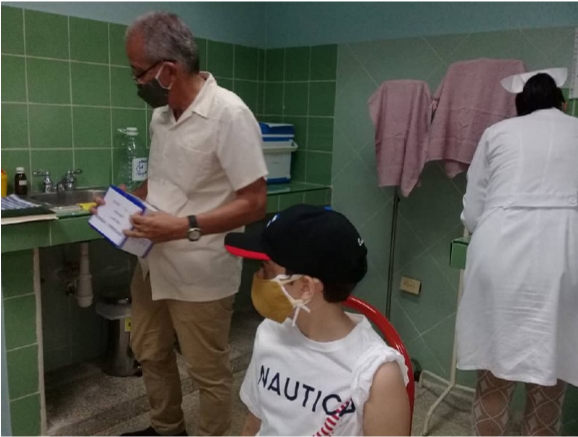
inspecciones a los sitios clinicos en Cienfuegos para el proceso de evaluación de Soberana Plus.