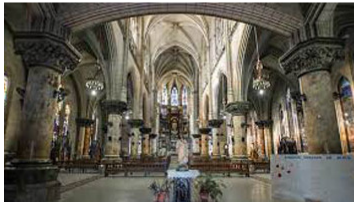
Interior de la iglesia de Reina

En esa oportunidad lograron salvar la empinada torre de un desplome seguro. Los arquitectos buscaron soluciones para garantizar su estabilidad y después de varios estudios “se le confirió a la estructura pétreo original una robusta osamenta metálica, mediante anclajes cuidadosamente dispuestos, soporte y riostras”.