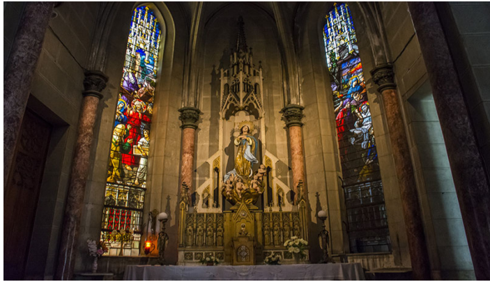
Altar iglesia de Reina

El interior, de deslumbrante belleza, asombra por el trabajo cuidadoso y detallado de cada ornamento. También impresionante por la gigantesca imagen del Sagrado Corazón, esta vez, en actitud de bendecir a sus fieles, tallada en madera al estilo bizantino, que preside el altar mayor.