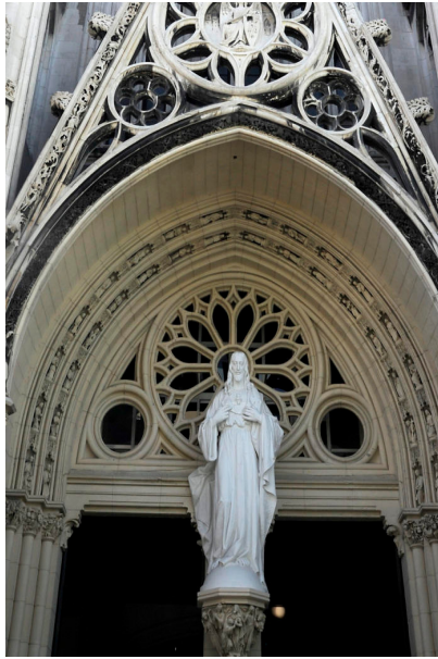
Entrada de la iglesia del Sagrado Corazón de Jesús

Catalogada por los especialistas como una joya neogótica, fue hecha al estilo de las catedrales del siglo XIII, respetando los detalles del estilo gótico, arco apuntado, arbotantes y contrafuertes que sostienen las altas bóvedas ojivales, amplios ventanales con luminosos vitrales.