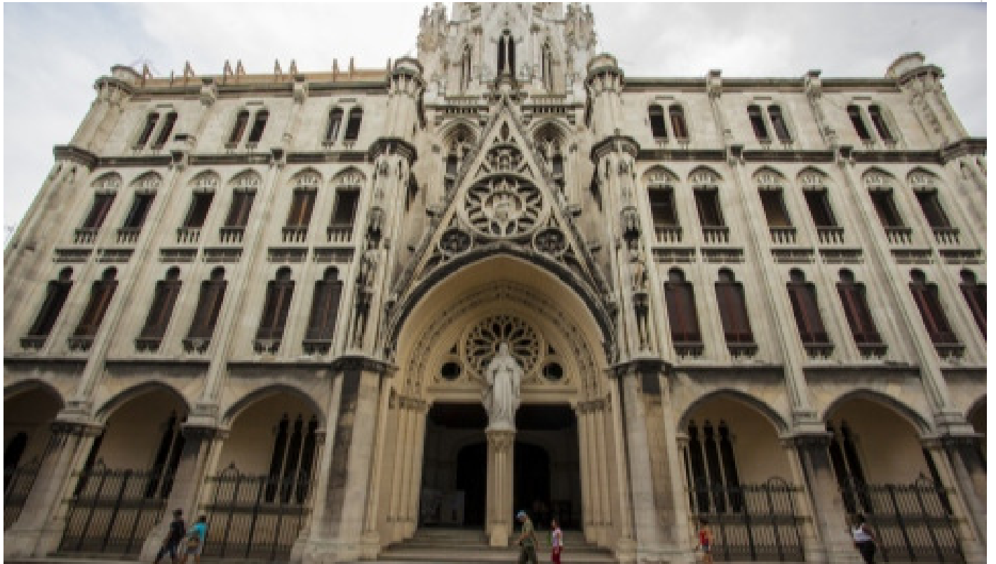
Iglesia del Sagrado Corazón de Jesús