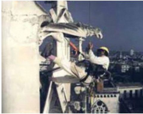
Restauración iglesia Reina

No es una tarea fácil, pues la estructura está cargada de ornamentos y detalles, sería imperdonable perderlos.