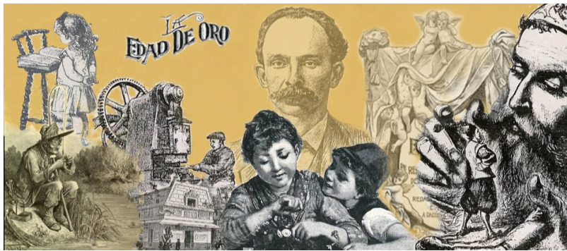
Martí y La Edad de Oro

Así lo comprendió José Martí. Entregó al periodismo una parte importante de su actividad creadora, con el objetivo de vincular el futuro de la isla al destino de la América Latina toda. Conocidos son los textos escritos para el diario La Nación, de Buenos Aires, en los que devela, entre otras muchas cosas, las intenciones ocultas tras la Conferencia Monetaria Panamericana celebrada en Washington. Su tarea fundadora en este sentido fue mucho más allá.