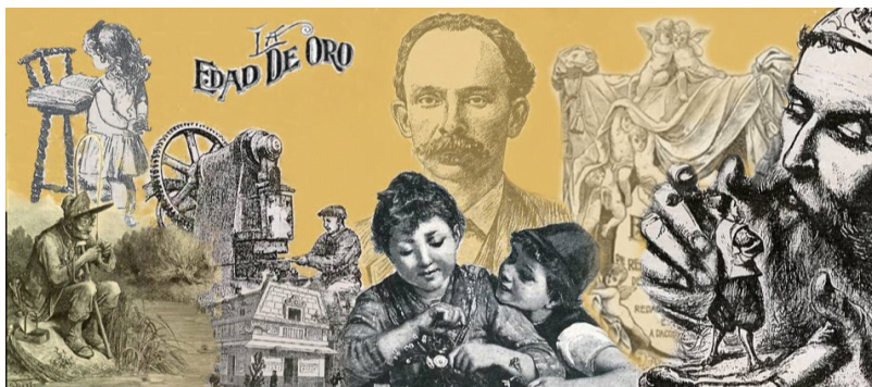
Martí y La Edad de Oro

Así lo comprendió José Martí. Entregó al periodismo una parte importante de su actividad creadora, con el objetivo de vincular el futuro de la isla al destino de la América Latina toda. Conocidos son los textos escritos para el diario La Nación, de Buenos Aires, en los que devela, entre otras muchas cosas, las intenciones ocultas tras la Conferencia Monetaria Panamericana celebrada en Washington. Su tarea fundadora en este sentido fue mucho más allá.