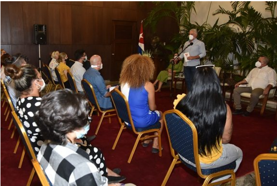
Intercambio del presidente cubano con representantes de la comunidad LGBTIQ+ en Cuba.