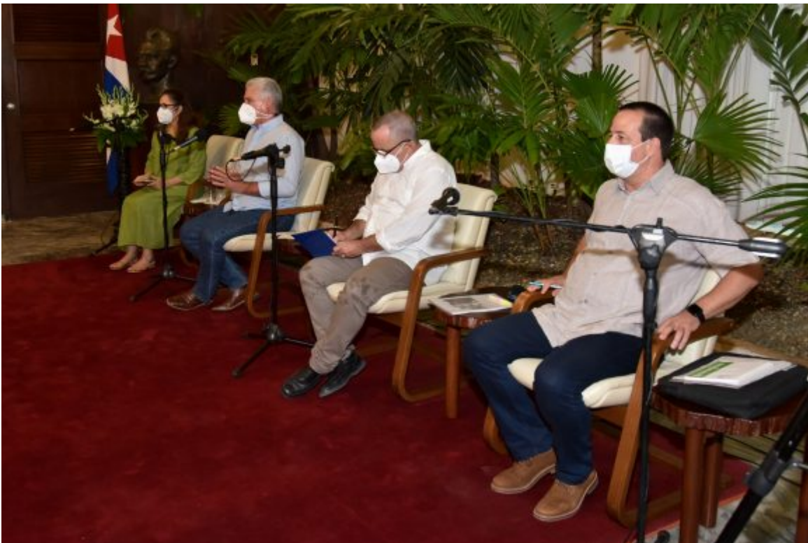
Autoridades del país intercambian con representantes de la comunidad LGBTIQ+ en Cuba.

“Creo que lo principal que estamos abordando es que estamos defendiendo un grupo de convicciones, un grupo de principios”, expresó el presidente Díaz-Canel a sus interlocutores, a quienes recordó que se trata de desmontar un paradigma patriarcal de dominación que se ha impuesto durante años, en un proceso histórico social que hemos vivido y que por lo tanto ha provocado incomprendiones, prejuicios.