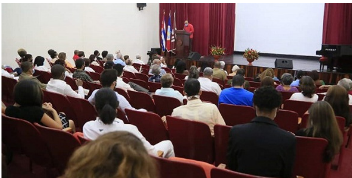
Universidad de Oriente, institución relevante de la Academia de Ciencia de Cuba