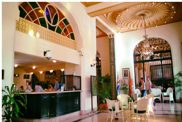
Carpeta del hotel Inglaterra

Se dice asimismo que ella lo veía fumar en el restaurante del Inglaterra y que se atrevió a pedirle que la enseñara a hacerlo, pero no en público. Las clases, un día en la habitación de la francesa y otro en la del español, duraron toda una semana. (Tomado de Juventud Rebelde)