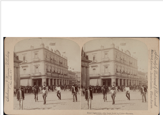
Foto antigua del hotel Inglaterra