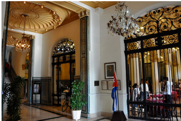
Interior hotel Inglaterra

El hombre que clama Luis Morote, como buen periodista, estaba bien informado. El mayor general Antonio Maceo, en efecto, es huésped del hotel Inglaterra, una estancia que se prolonga entre febrero y julio de ese año.