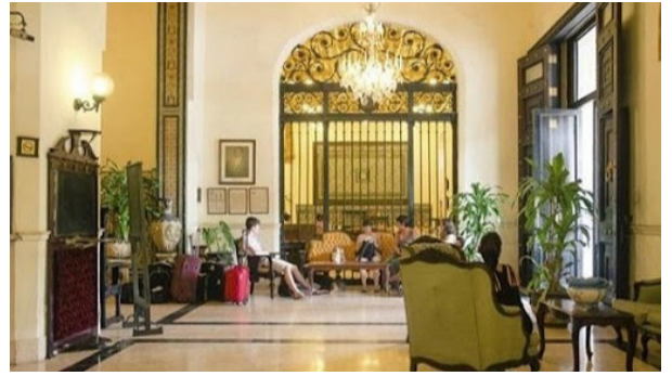
Lobby del hotel Inglaterra

«Salimos de la calle de la Muralla, donde los comerciantes estaban a las puertas de las tiendas en mangas de camisa, sin vender tal vez por ser domingo, y nos encaminamos hacia el Parque Central», dice el español en la primera de sus crónicas cubanas, escrita en vísperas de su viaje a la trocha de Júcaro a Morón. Le parece hermoso el Parque Central. Su entorno es de maravilla. Coinciden en sus alrededores los teatros Tacón, Albisu y Payret. También lo que sería la Manzana de Gómez y el Diario de la Marina —en el edificio del hotel Plaza— y frente a este, el lujoso Unión Club.