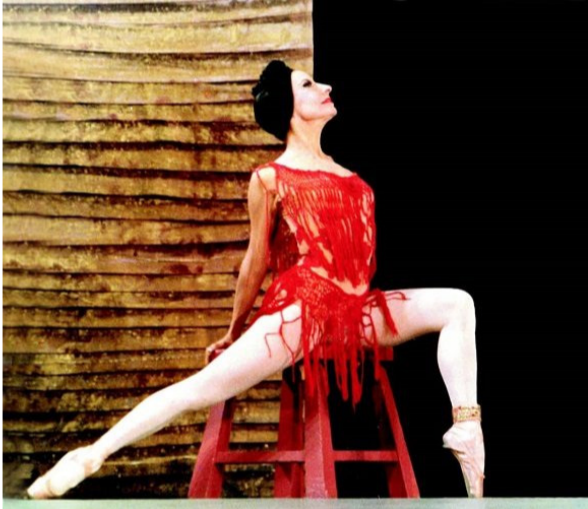
Alicia Alonso.