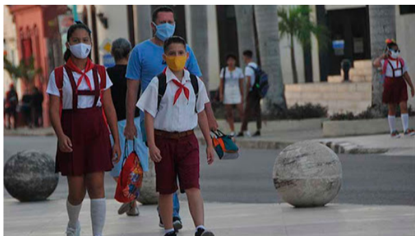
Escolares frente al covid

subsistente en quienes, poniendo en riesgo su bienestar, han acudido en ayuda de los necesitados, desconocidos ayer y quizá olvidadizos mañana.