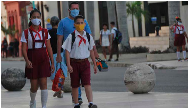
Escolares frente al covid

subsistente en quienes, poniendo en riesgo su bienestar, han acudido en ayuda de los necesitados, desconocidos ayer y quizá olvidadizos mañana.