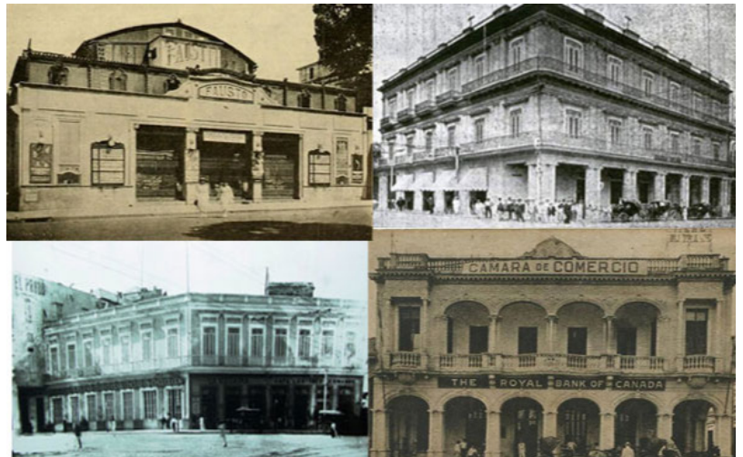
Cine Fausto, Prado y Neptuno, Hotel Telégrafo y The Royal Bank of Canadá

En Prado comenzaron los habaneros a conocer el cine hablado. El hecho, de relieve cultural, ocurrió en el cine Fausto, en Prado y Colón. En Prado y Neptuno, en una sala de fiesta surgió, con el título de La engañadora y autoría de Enrique Jorrín, el primer chachachá. En la esquina de San Miguel, el hotel Telégrafo exhibió en su fachada el primer anuncio lumínico que se conoció en La Habana. Se trataba de una bandera cubana hecha con bombillos incandescentes y en movimiento, con la que se promocionaba la cerveza La Tropical. El 11 de agosto de 1948, sobre las tres de la tarde, tenía lugar en la sucursal de The Royal Bank of Canadá, de Prado 307, el robo mayor de dinero en efectivo que haya ocurrido en Cuba, al sustraerse más de medio millón de pesos. En la casa marcada hoy con el número 309 murió el poeta Julián del Casal.