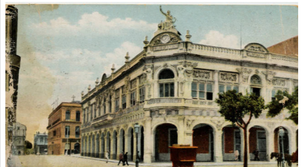
Diario de la Marina

Diario de la Marina, periódico fundado en 1832, tuvo no menos de nueve domicilios hasta su emplazamiento definitivo en Prado y Teniente Rey, edificio construido a un costo de millón y medio de pesos. El decano de la prensa cubana, como se le llamaba todavía en 1960, fue vocero de la burguesía y, en especial, de los intereses españoles en Cuba y en menor medida de banqueros y hacendados.