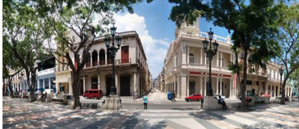
Prado y Trocadero