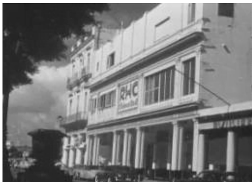
Radio Cadena Azul

Casi en el otro extremo del Paseo, en el número 53, se alzaba el llamado Palacio de la Radio, sede de RHC Cadena Azul y la Cadena Roja, emisoras pertenecientes a Amado Trinidad. Otras radioemisoras de la calle eran Radio Mambí (107) y Radio Caribe, que desde el edificio del Club de Cantineros se mantenía 24 horas al aire. Radio Continental, en el 206, y Radio García Serra, en el 260. En el Paseo del Prado radicaban asimismo la corresponsalía de la Prensa Unida (158) y las redacciones de Diario de Cuba (412) y la revista Lux (615). (Tomado de Juventud Rebelde)