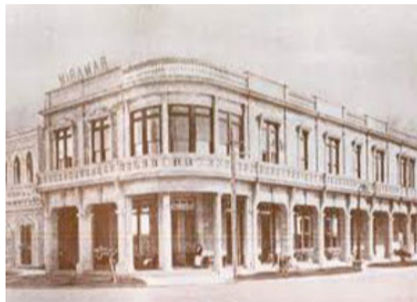
Hotel Miramar en Prado y Malecón