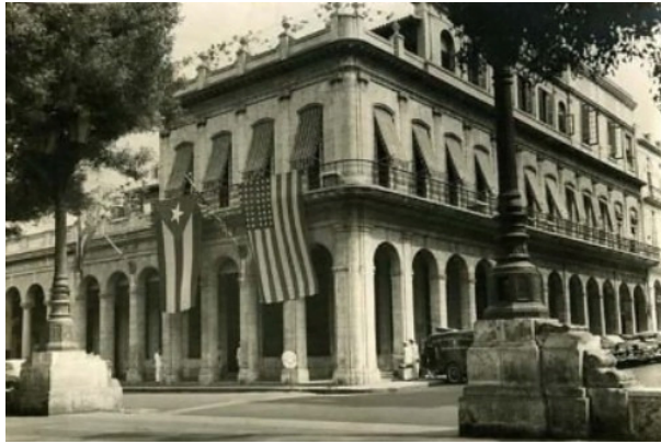
Prado y Virtudes