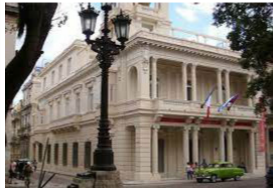
Casa de José Miguel Gómez

Muchos recuerdos atesora el Paseo del Prado. Buenos y malos. Tristes y alegres.