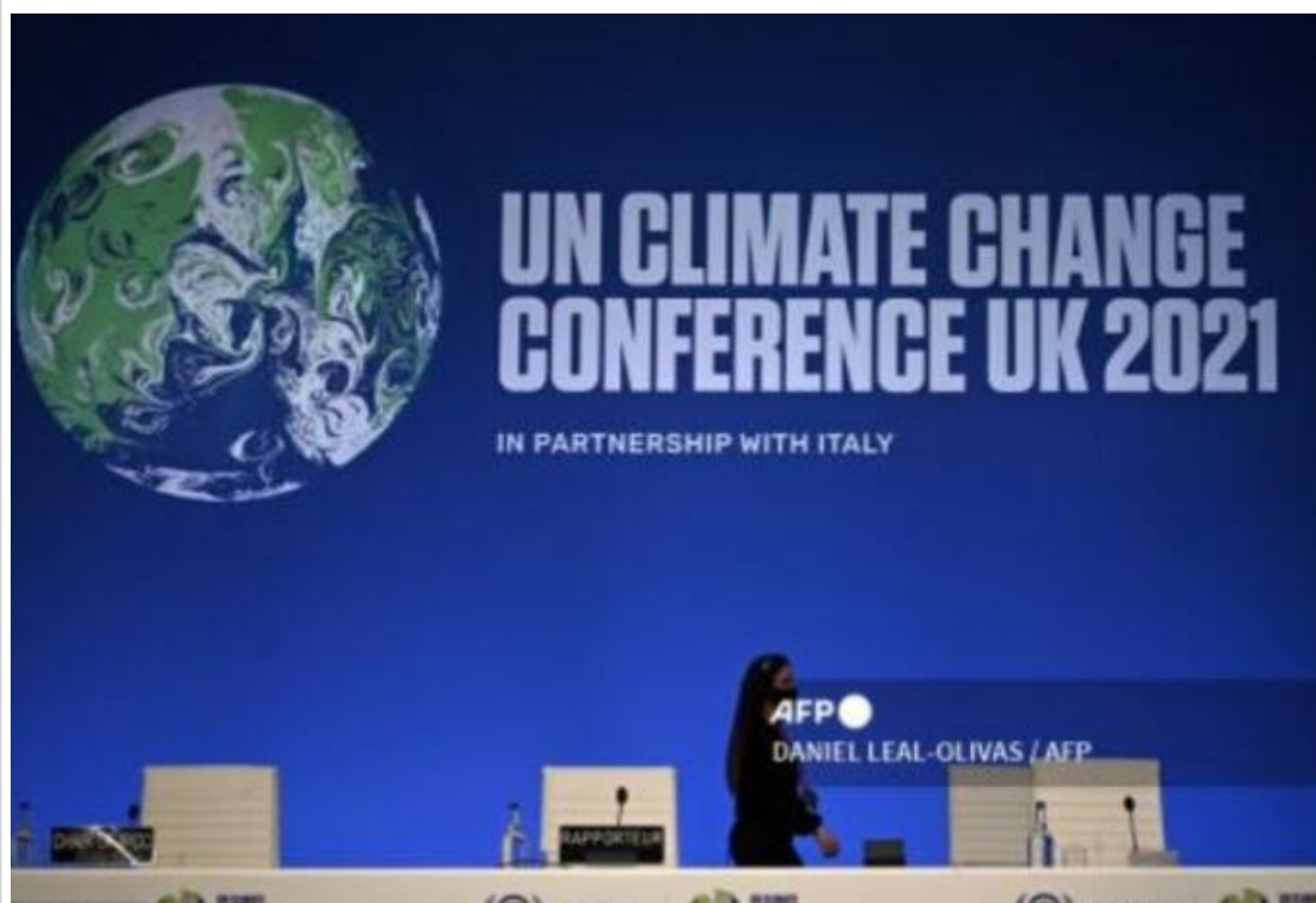
Cumbre del clima COP26

Es la hora de la verdad para que el mundo demuestre su verdadero compromiso con el cambio climático, añadió