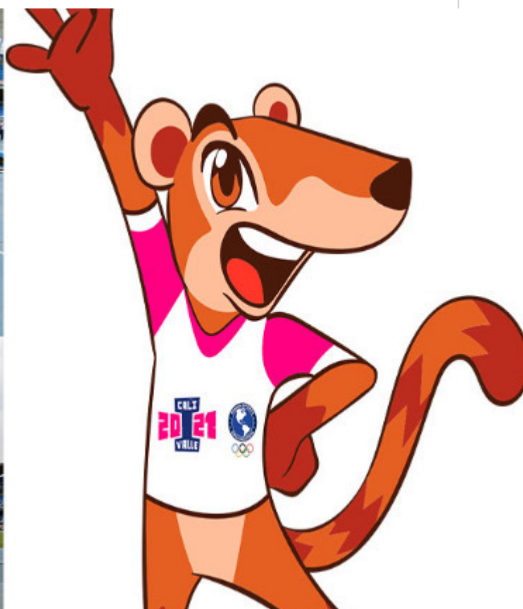
Pana, mascota de Cali-Valle 2021

Bogotá, 10 nov (PL) - Colombia continúa la preparación de los I Juegos Panamericanos Junior Cali-Valle 2021 cuya mascota o personaje será Pana, símbolo de amistad.