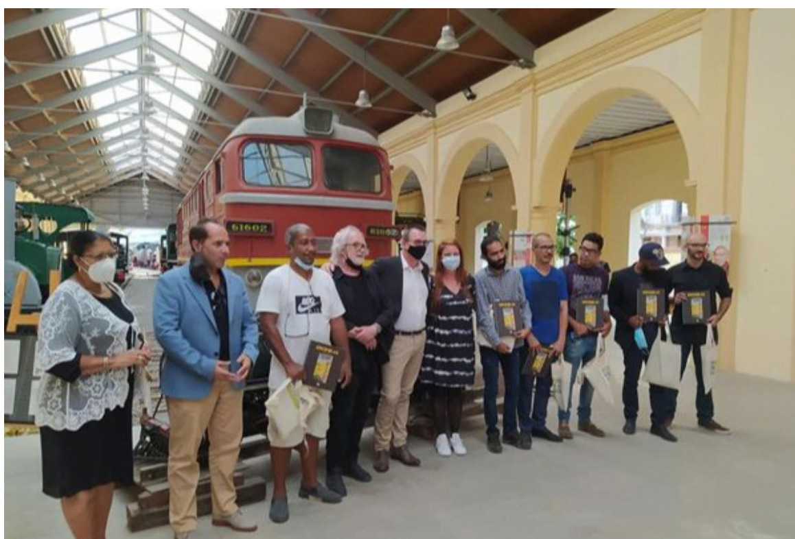
Semana Belga en La Habana aproxima a universo ferroviario de Cuba.

La Habana, 11 nov (RHC) Como parte de la 16 Semana Belga en La Habana, la exposición Trenes exhibe varias piezas dedicadas al universo ferroviario en Cuba, que integran el primer número especial de la publicación Krónikas-El inventario imaginario.