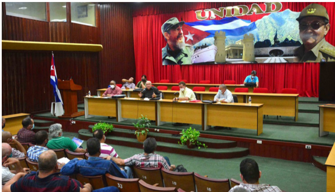
Llama Tapia Fonseca a estremecer la industria azucarera en Granma

Bayamo, 11 nov (RHC) El viceprimer ministro cubano Jorge Luis Tapia Fonseca resaltó en Bayamo la necesidad de estremecer la industria azucarera en Granma, como corresponde a la historia, cultura y tradiciones del sector en el oriental territorio, que llegó a ser ejemplo para el país.