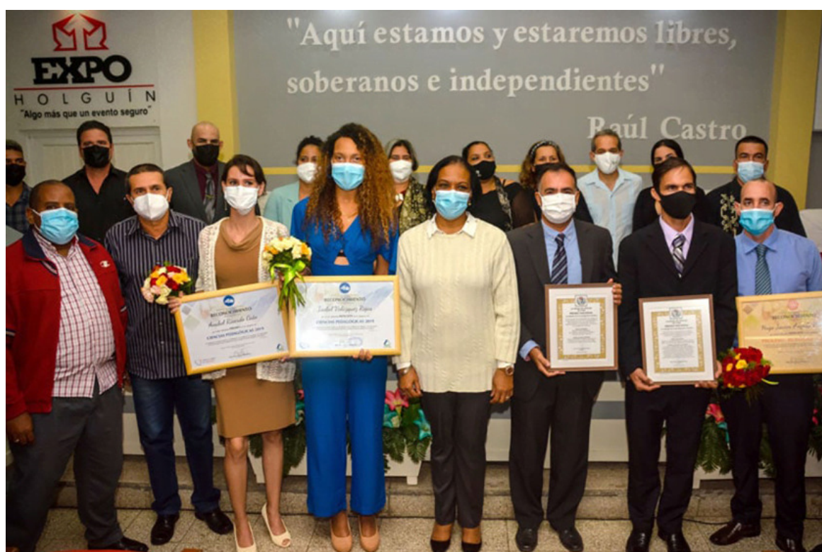
Entregan en Holguín premios nacionales Academia de Ciencias de Cuba

Holguín, 11 nov (RHC) Los Premios Nacionales Academia de Ciencias de Cuba (ACC), correspondientes a investigadores de la provincia de Holguín, se otorgaron la víspera en la oriental ciudad como reconocimiento a la inserción de esta rama en el ámbito económico y social.