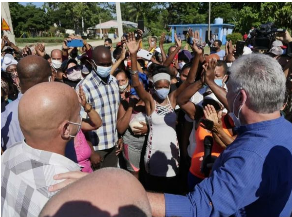
Díaz Canel en Guantánamo reunido con el pueblo

https://www.radiohc.cu/noticias/nacionales/276840-presidente-cubano-visita-provincia-de-guantanamo