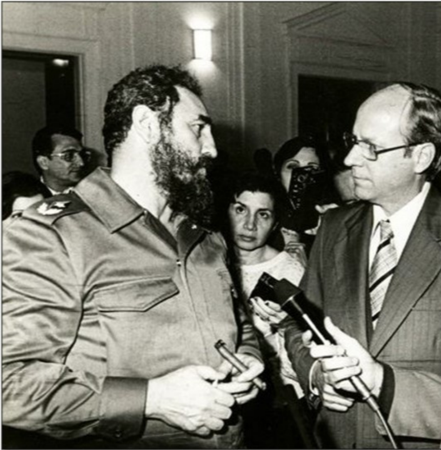
Imágenes de archivo.

La intervención del líder histórico de la Revolución Cubana se produjo el viernes 12 de octubre de 1979 en el 34 período de sesiones de la Asamblea General de las Naciones Unidas.