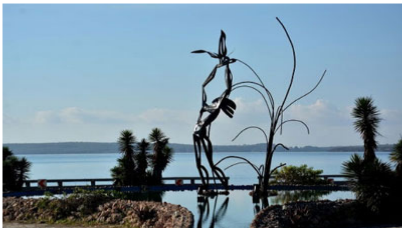
Escultura de la india Guararoca

Grande fue la alegría del primer hombre. Al fin tenía un ser con quien compartir goces y penas, alegrías y tristezas, diversiones y trabajos. Los dos se amaron, con frenesí, con inacabable pasión, sin saber todavía lo que era el hastío. De su unión nació Imao, el primer hijo.