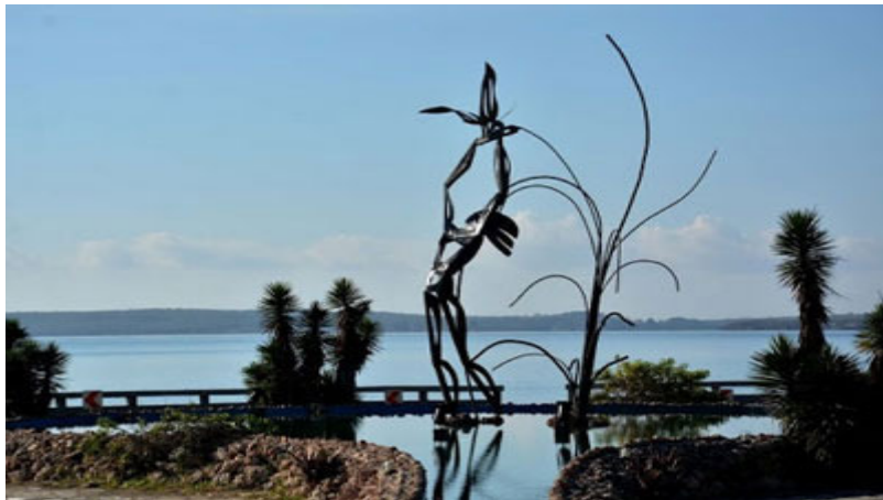
Escultura de la india Guararoca

Grande fue la alegría del primer hombre. Al fin tenía un ser con quien compartir goces y penas, alegrías y tristezas, diversiones y trabajos. Los dos se amaron, con frenesí, con inacabable pasión, sin saber todavía lo que era el hastío. De su unión nació Imao, el primer hijo.