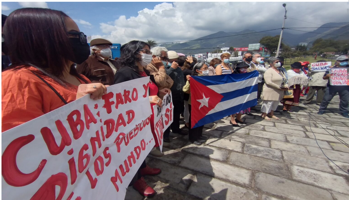
Solidaridad Ecuador Cuba

Quito, 13 nov (RHC) Representantes de misiones diplomáticas acreditadas en Ecuador, de la Coordinadora de Amistad y Solidaridad con Cuba, graduados universitarios en el archipiélago, asambleístas nacionales y cubanos residentes en este territorio sudamericano alzaron sus voces junto a la embajada de La Habana en Quito para condenar las agresiones y campañas de desestabilización que enfrenta el país caribeño.