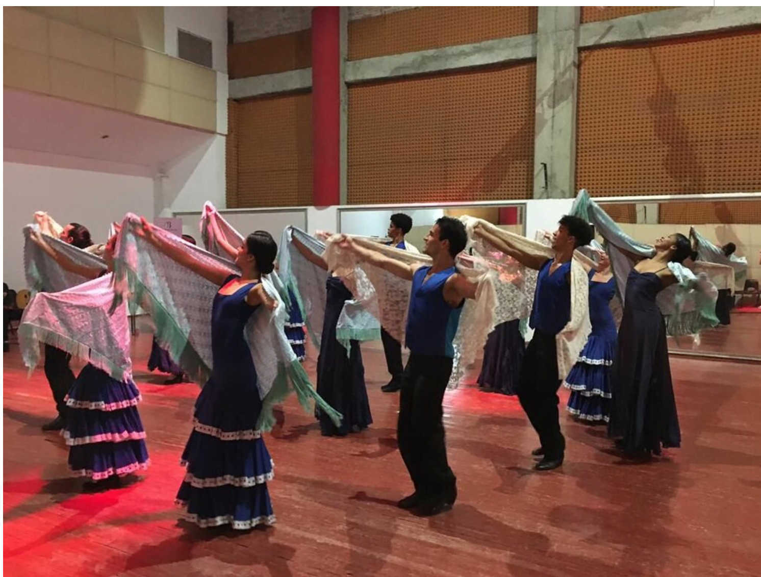
Ballet Español de Cuba regresa a los escenarios con el espectáculo Ascendencia Hispana.