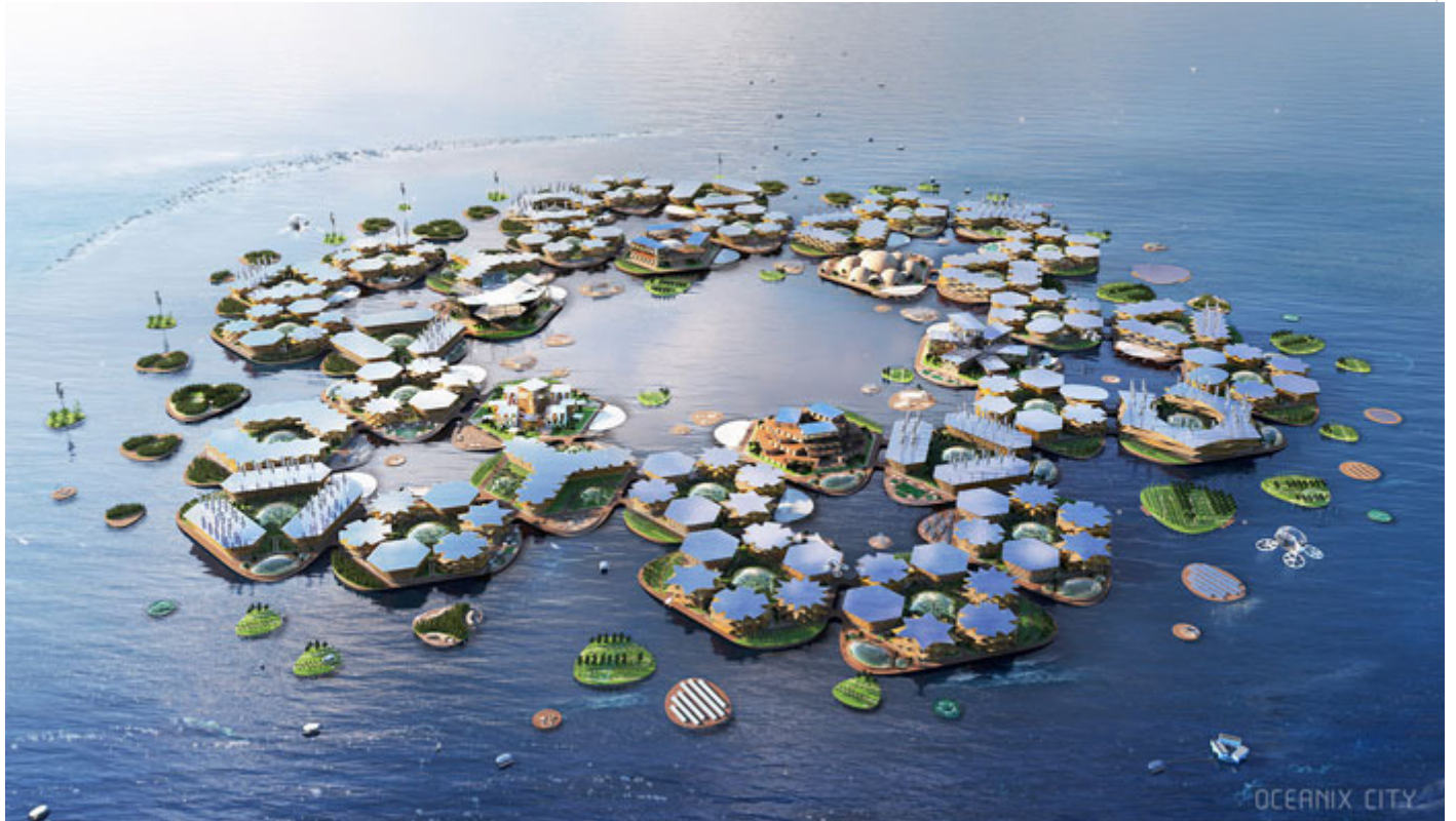
Ciudad Flotante en Corea del S

Noviembre 23- La ciudad surcoreana de Busan firmó el pasado jueves un acuerdo histórico con ONU-HABITAT, el programa de las Naciones Unidas para los Asentamientos Humanos centrado en la sostenibilidad ecológica, y la compañía privada Oceanix para construir el primer prototipo del mundo de una ciudad flotante autosuficiente.