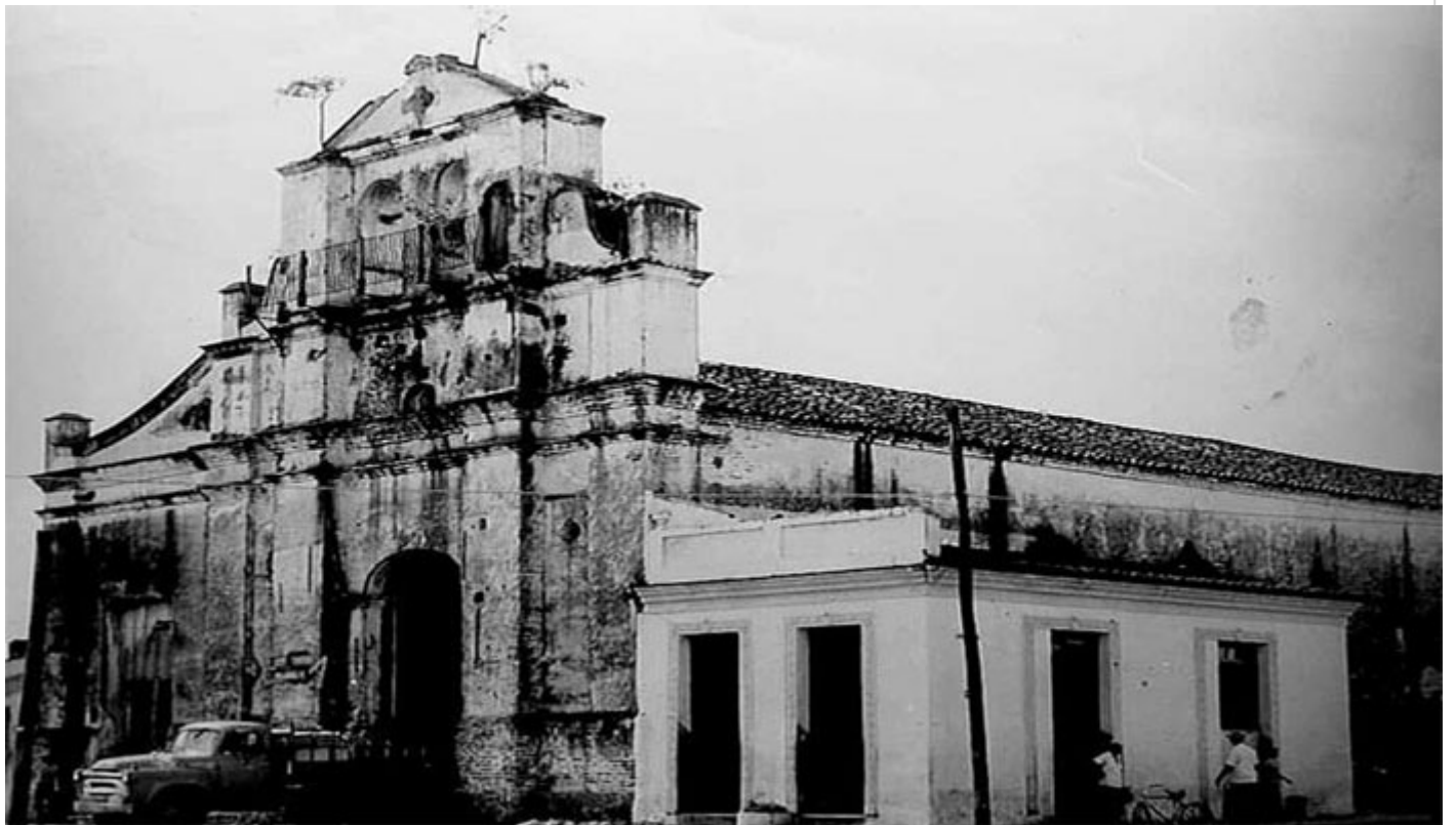
Antigua iglesia Jesús del Nazareno

Sancti Spíritus, 25 nov (RHC) Las excavaciones en la añeja iglesia Jesús Nazareno en esta ciudad patrimonial al centro de Cuba se reanudaron, en lo que se clasifica hoy como una intervención arqueológica integral, aseguró un experto.