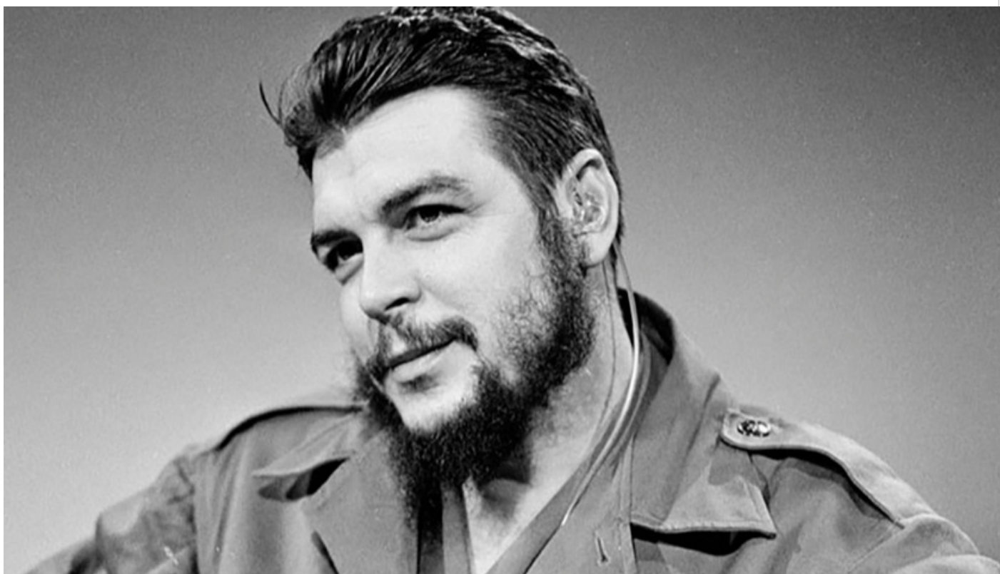
Comandante Ernesto Guevara

La Habana, 26 nov (RHC) La colocación de una ofrenda floral ante la placa que recuerda en la sede del Banco Central de Cuba, en La Habana Vieja, cuando el 26 de noviembre de 1959 el Comandante Ernesto Guevara tomó posesión como Presidente del Banco Nacional, abre hoy las actividades finales por el Día del Economista y Contador, fecha instituida precisamente por ese histórico acontecimiento.