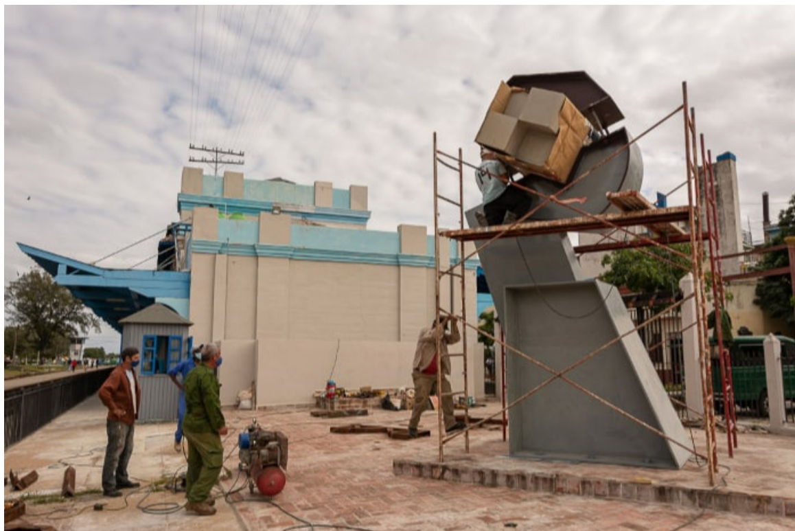
Instalada escultura El liniero en entorno ferroviario en Camagüey.

Camagüey, 28 nov (RHC) Como parte de las acciones para revitalizar el entorno del futuro Museo Ferroviario, de Camagüey quedó emplazada en sus inmediaciones la escultura El liniero, obra de Tomás Lara, artista cubano y presidente del Consejo Asesor para el Desarrollo de la Escultura Monumentaria.