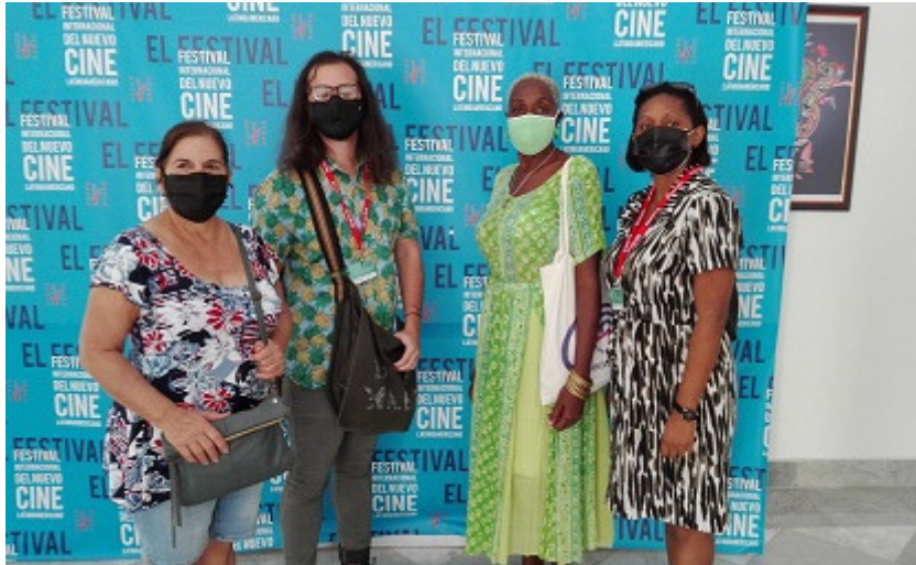
Jurado del Premio Roque Dalton, de Radio Habana Cuba.