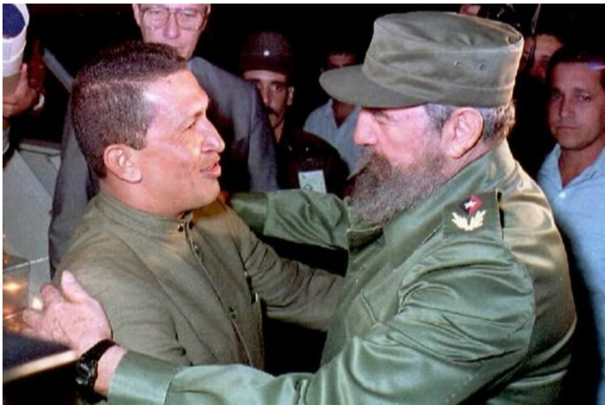
Hugo Chávez et Fidel Castro, le soir de leur première rencontre à La Havane, le 13 décembre 1994.

2021-12-13 08:15:16 /web.radiorebelde@icrt.cu / Angelica Paredes López