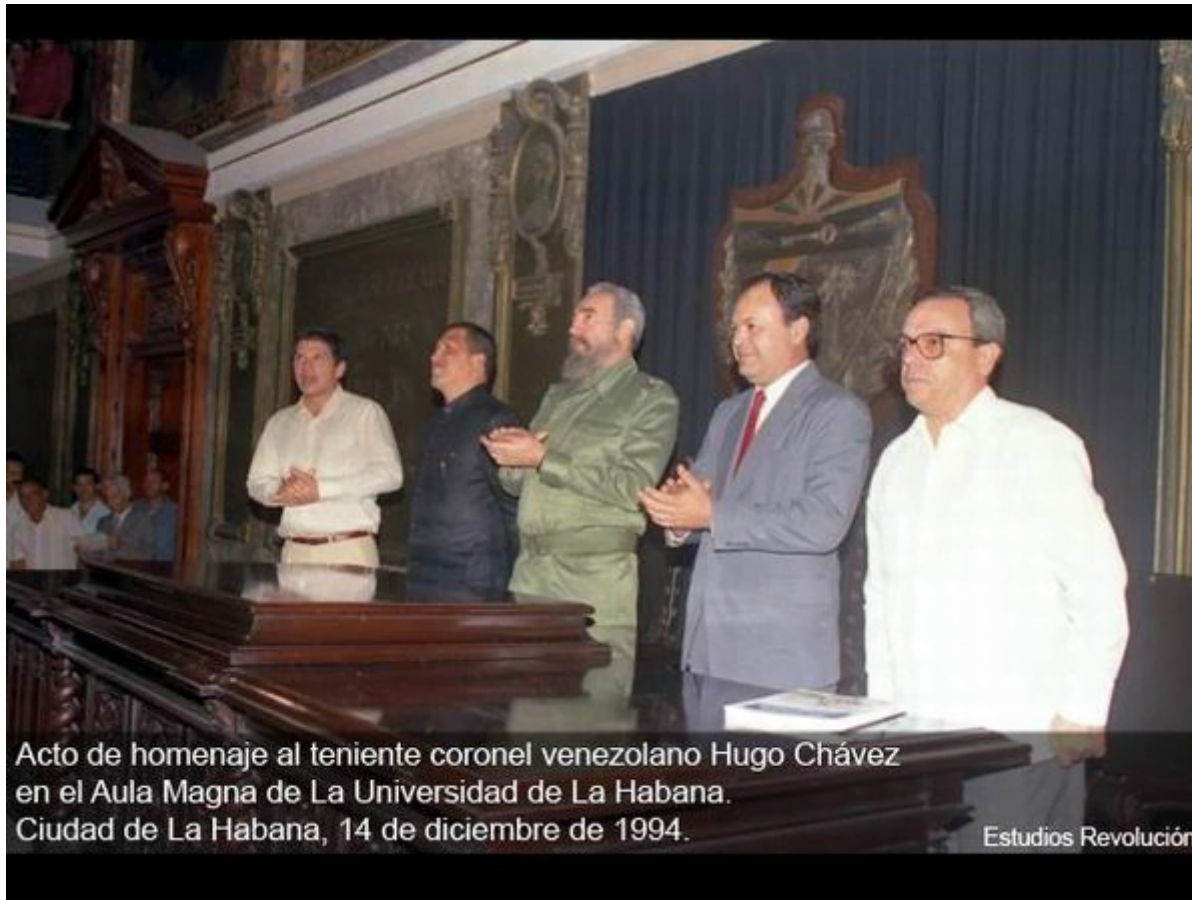
Acto de homenaje al teniente coronel venezolano Hugo Chávez en el Aula Magna de La Universidad de La Habana. Ciudad de La Habana, 14 de diciembre de 1994.