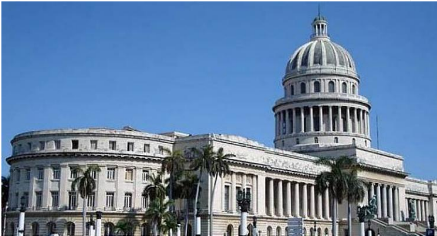
Sede del Parlamento cubano.

Condenó, de igual forma, los recientes intentos de desestabilización de la oposición en Bolivia.