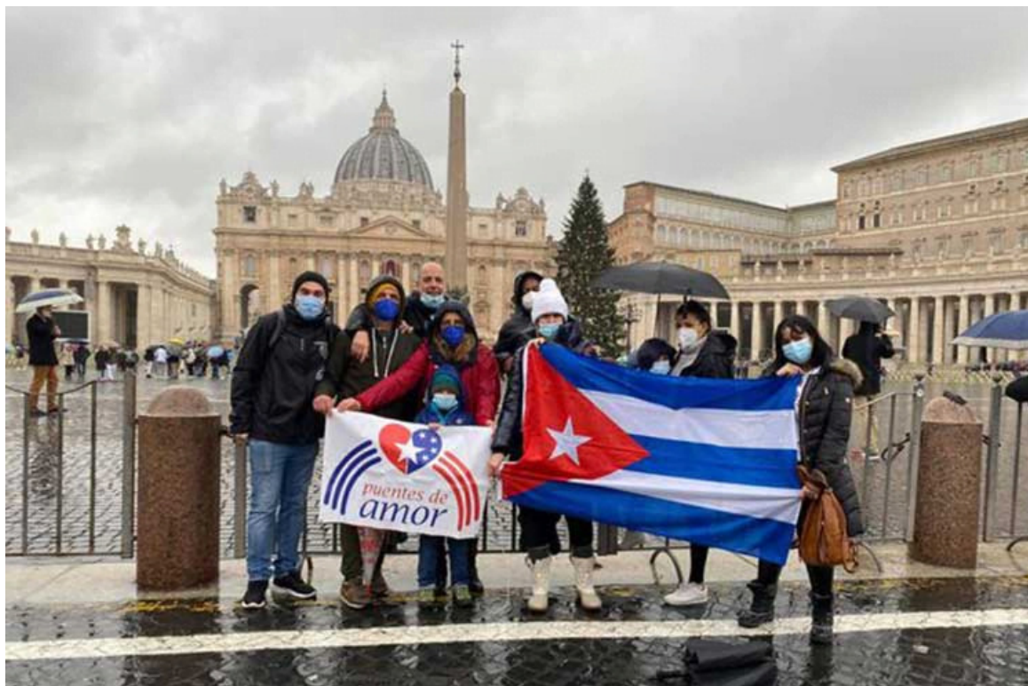
Destacan en Italia resultados de iniciativa Un camino de amor

Roma, 26 dic (RHC) La iniciativa "Un camino de amor" para promover el cese del bloqueo estadounidense a Cuba y la paz mundial sobrepasó las expectativas iniciales, expresaron sus organizadores.