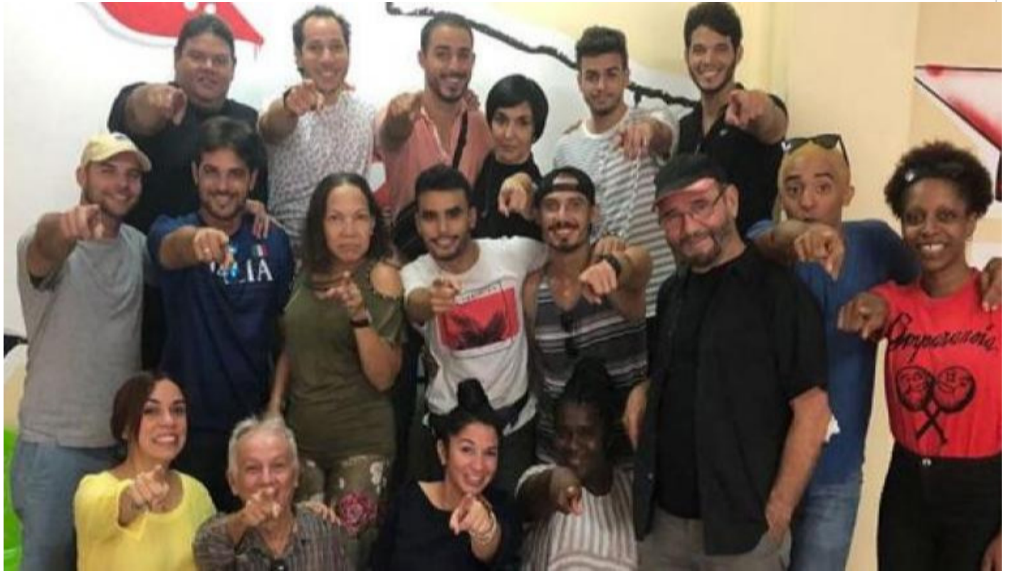
Personajes de la novela cubana Tú