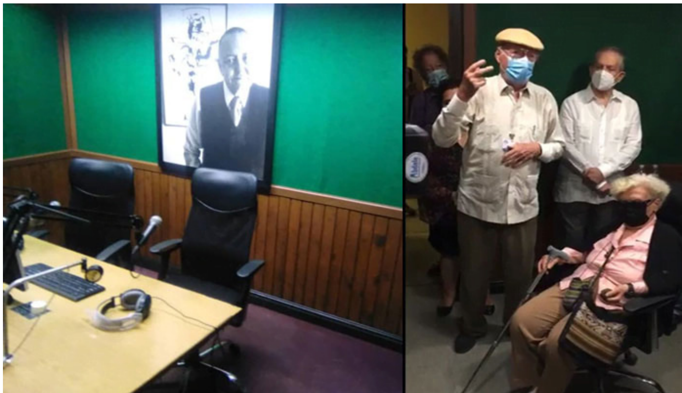
Estudio de grabación de RHC nombrado Alejo Carpentier