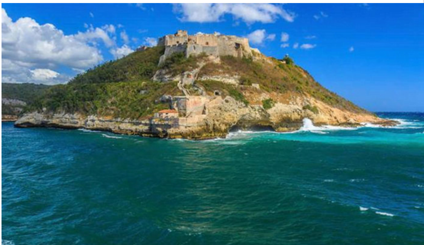
Castillo de San Pedro de la Roca o Castillo del Morro

La fortaleza militar Castillo de San Pedro de la Roca, también conocida como “Castillo del Morro”, sobresale como uno de los sitios más pintorescos de la caribeña Santiago de Cuba.