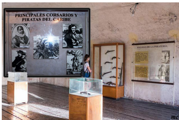
Museo de Piratas en el castillo del Morro de Santiago de Cuba

Antiguamente se le conocía como el Museo de la Piratería, pero cambió su nombre para amoldarse a los nuevos contenidos del museo más generales y relacionados con el entorno en el que se encuentra en Santiago de Cuba.