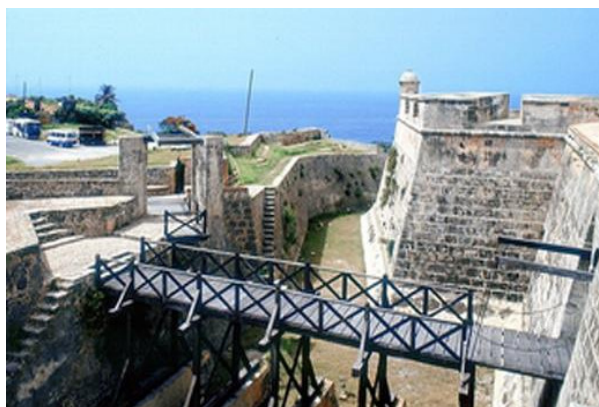
Fortaleza San Pedro de la Roca, Castillo del Morro en Santiago de Cuba

Posee un alto valor artístico por la concepción de su diseño y emplazamiento, además de gran autenticidad y originalidad, con terrazas superpuestas que se enlazan entre sí a través de rampas y escaleras, debido a que se encuentra perfectamente adaptada a un relieve desigual, que determina la existencia de un frente de tierra ubicado aproximadamente a 70 metros sobre el nivel del mar y al mismo tiempo un frente de mar a 10 metros de altura.