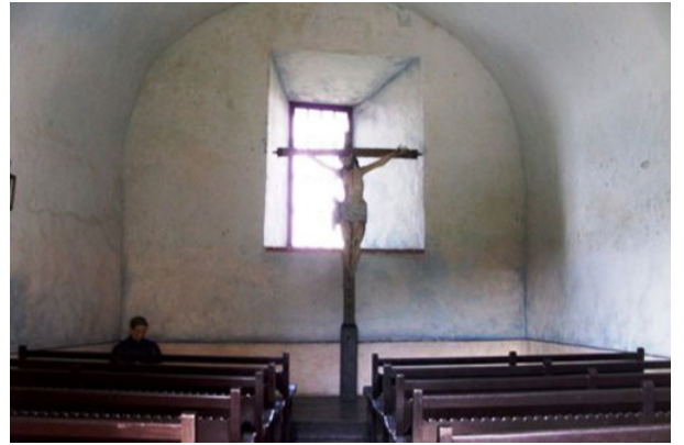
Capilla del Morro de Santiago de Cuba

Por su gran valor histórico y arquitectónico esta fortaleza o castillo fue declarada por la UNESCO Patrimonio de la Humanidad en 1997.