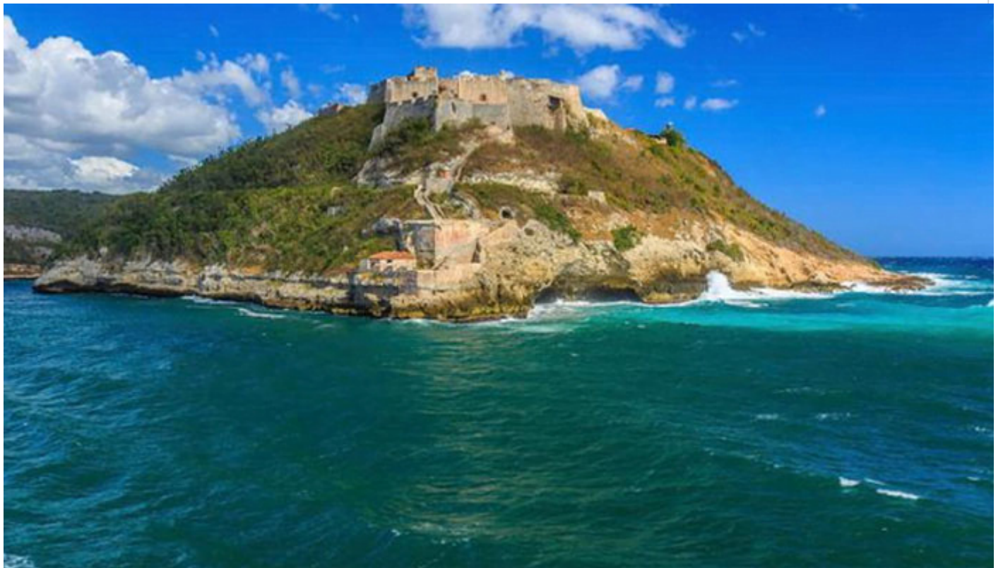
Castillo de San Pedro de la Roca o Castillo del Morro

La fortaleza militar Castillo de San Pedro de la Roca, también conocida como “Castillo del Morro”, sobresale como uno de los sitios más pintorescos de la caribeña Santiago de Cuba.