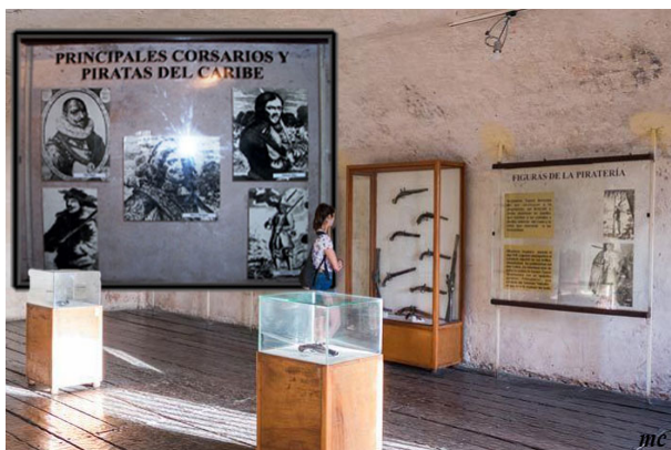
Museo de Piratas en el castillo del Morro de Santiago de Cuba

Antiguamente se le conocía como el Museo de la Piratería, pero cambió su nombre para amoldarse a los nuevos contenidos del museo más generales y relacionados con el entorno en el que se encuentra en Santiago de Cuba.