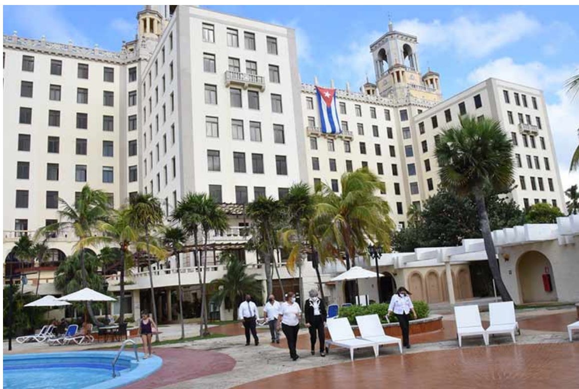
Hotel Nacional cumple 91 años liderando sector turístico en Cuba

La Habana, 30 dic (RHC) Considerado como la joya de la hostelería en Cuba, el Hotel Nacional cumple este jueves 91 años y se reafirma en la vanguardia del sector turístico en el país.