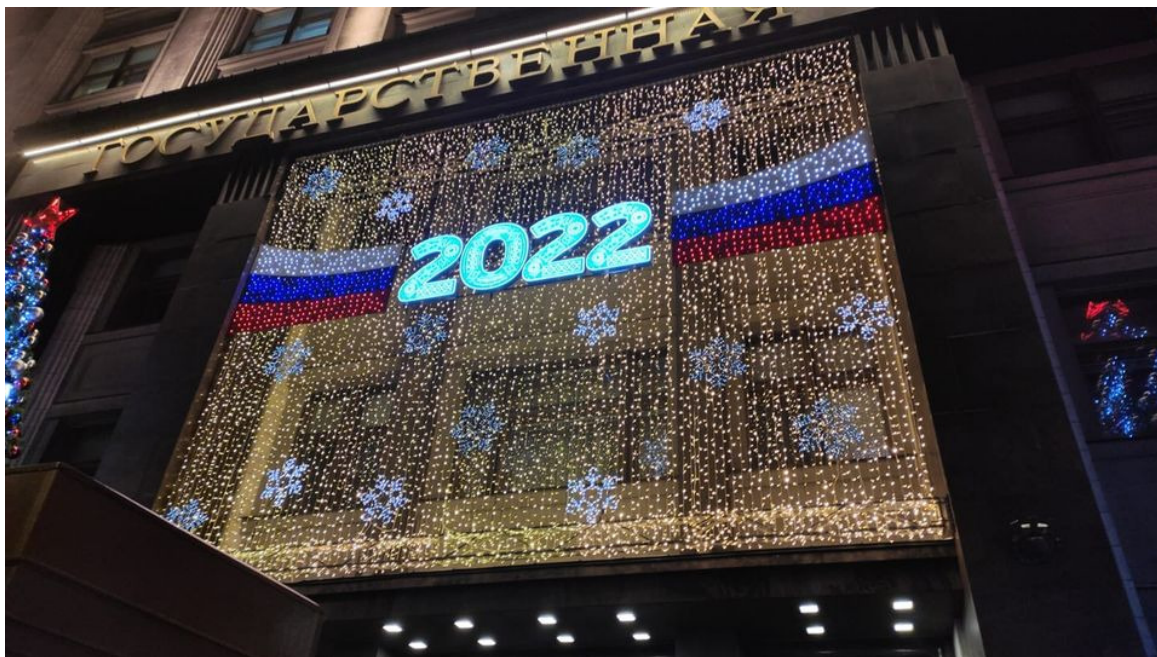
Rusia inicia feriados de Año Nuevo

Moscú, 31 dic (RHC) Rusia inició sus feriados de Año Nuevo hasta el 10 de enero, período que incluye la celebración el día siete de la Navidad por la Iglesia Ortodoxa, que mantuvo la celebración según el calendario juliano.