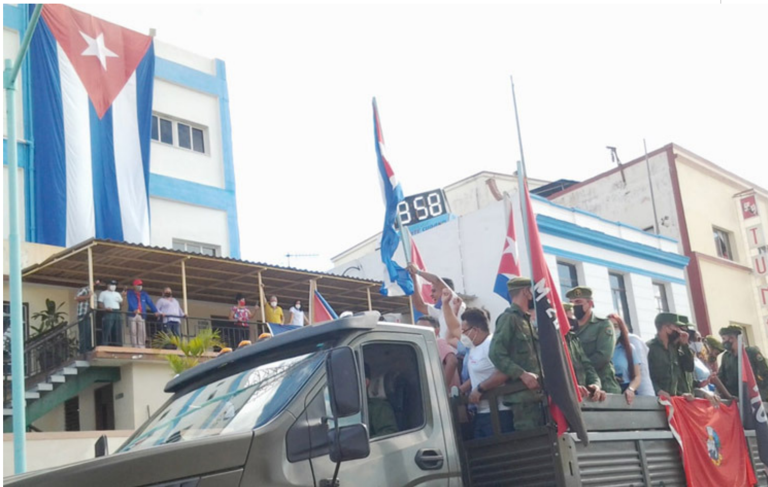
Reedición de la Caravana de la Libertad a su paso por Las Tunas.

Las Tunas, 4 ene (RHC) Jóvenes de Las Tunas reeditaron el paso de la Caravana de la Libertad por esa ciudad, convertidos en rebeldes que luchan desde las trincheras del estudio y el trabajo cual protagonistas de la victoriosa hazaña que hace 63 eneros dio el triunfo definitivo a la Revolución cubana.