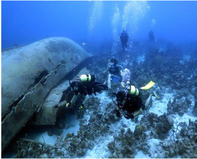
Centro Internacional de buceo en Punta Perdiz

Punta Perdiz constituye un centro internacional de buceo en la costa sur de la provincia de Matanzas, en la muy conocida Ciénaga de Zapata, y por tanto permite una variedad de recorridos por el lugar.