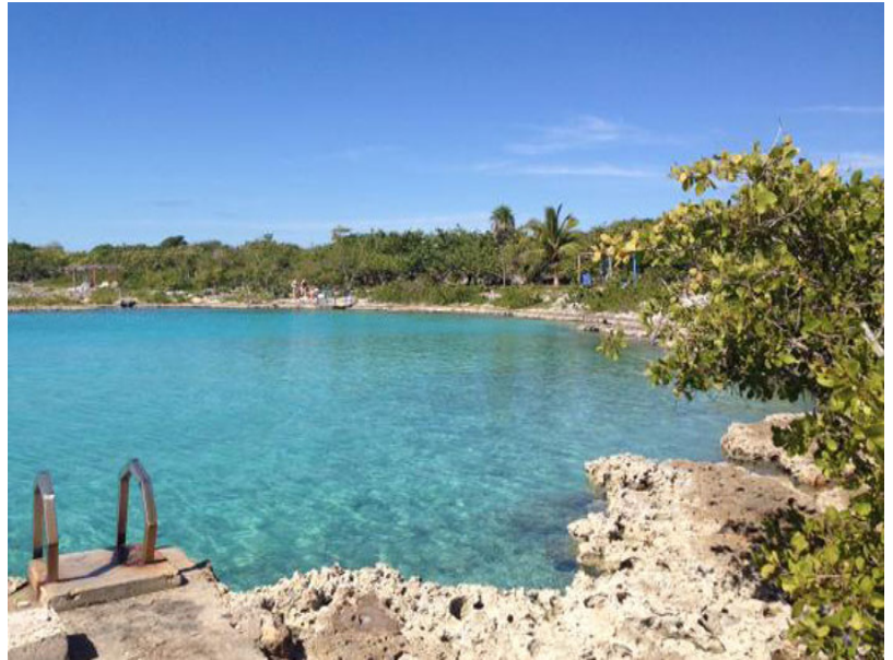
Caleta Buena, Cuba

Entre los sitios preferidos por los que se involucran en esa aventura, sobresalen la Cueva de los Peces, una caverna de 80 metros de profundidad, y Caleta Buena, con entorno de piscinas naturales y fondos de coral, de gran atracción para el buceo, en el entorno de Playa Girón.