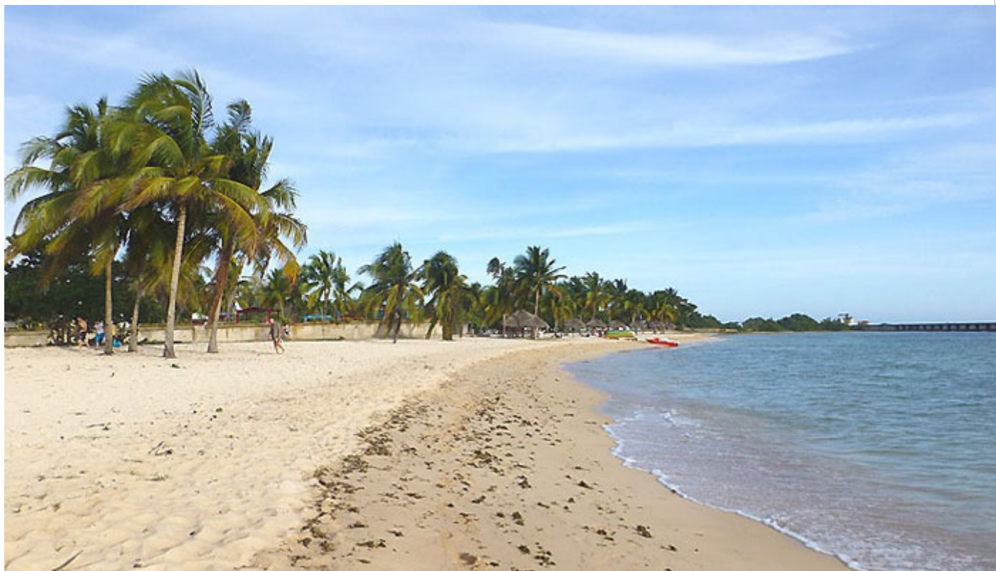
Paya Girón, Cuba

Cuba cuenta con muchos puntos marinos de renombre y cualidades significativas de cara a los amantes de la naturaleza y el mar, donde hoy destaca Punta Perdiz en el occidente insular.