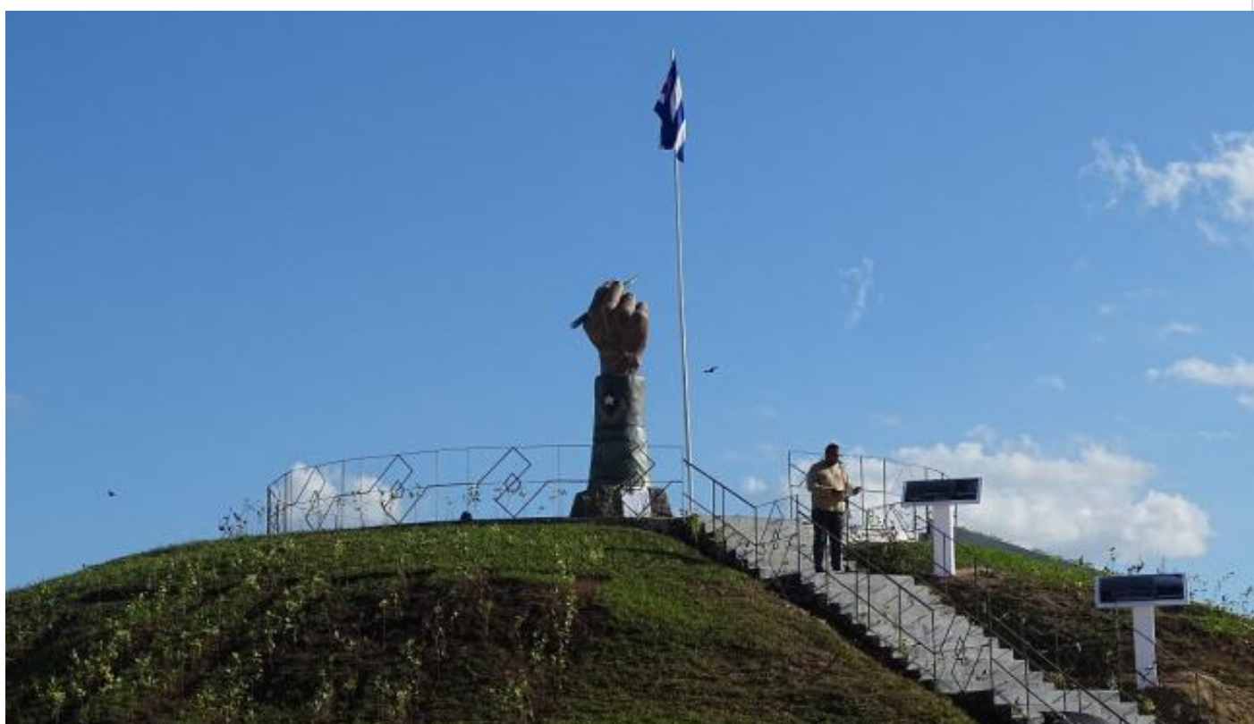
Conjunto escultórico Cienfuegos

Cienfuegos, 6 enero (RHC) En saludo al aniversario 63 de la Revolución quedó expuesto al público un complejo escultórico que evoca la visita al lugar, en 1969, del líder histórico de la Revolución Cubana el Comandante en Jefe Fidel Castro.