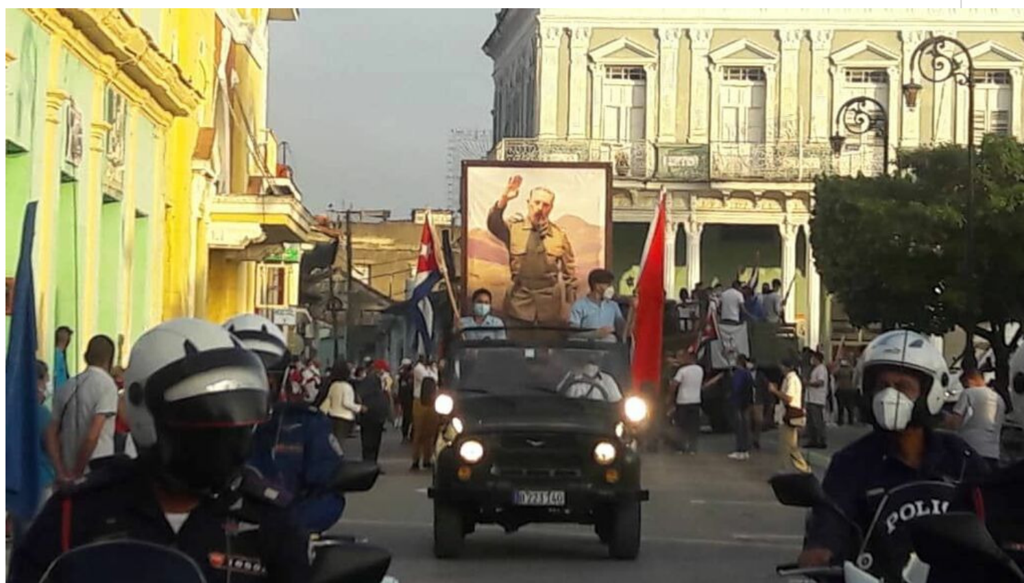
Caravana de la Libertad a su paso por Sancti Spíritus.

Sancti Spíritus, 6 ene (RHC) Aunque han pasado 63 años de la entrada de la Caravana de la Libertad aquel 6 de enero de 1959 a esta central localidad, el recuerdo de los barbudos guiados por el eterno líder Fidel Castro sigue intacto en el pueblo, que ha hecho suyas las palabras de entonces del Comandante en Jefe.