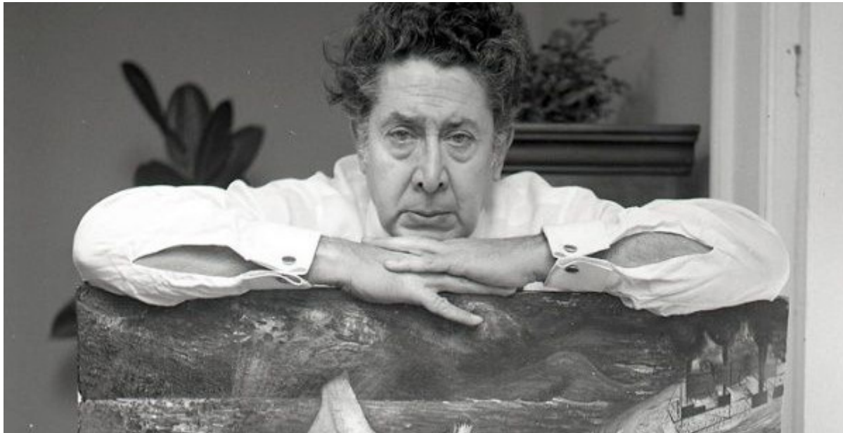
Una de sus obras más importantes es “Del porfirismo a la Revolución”.

Cuando hablamos del arte mexicano, no podemos dejar de mencionar muchas figuras trascendentales, entre ellas Frida Kahlo, María Izquierdo, Diego Rivera, Aurora Reyes y David Alfaro Siqueiros (en la foto).