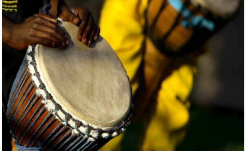
Tambores tocan música de los Orishas

Detrás, se encuentra la reina del cabildo, que coquetea descaradamente con un mozo blanco que la mira de forma insistente. La muchacha, de tez mulata y extraordinaria belleza, se abanica con el agbebé de Ochún, la diosa de la sensualidad en el panteón yoruba, y va coronada con una tiara de falsos diamantes y cristalitos que brillan cuando la luz del sol les da directamente.