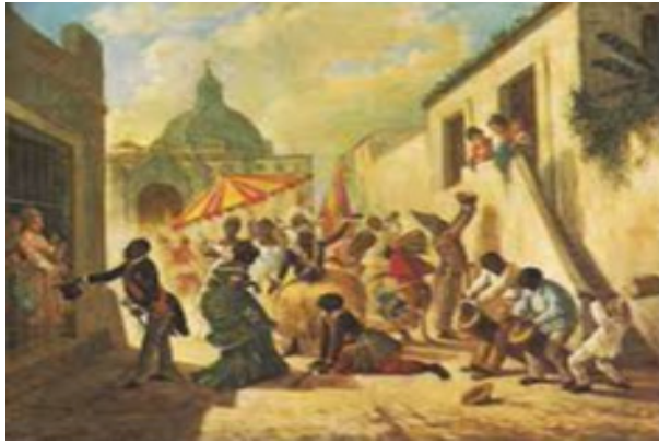
Fiesta del Cabildo el Día de Reyes

Solo rompe con esa calma la vorágine que hay en el interior de las pequeñas casas situadas cerca de la muralla, donde, desde 1792, por orden del Bando de Buen Gobierno y Policía, radican los cabildos de nación africana. Con la serenidad y dedicación con que se prepara un ritual, negros y mulatos mezclan pinturas para luego untarlas en sus cuerpos; se visten con indumentarias y ropajes llamativos y exóticos, y, tras ser autorizados por sus santos, los iniciados en la religión yoruba ajustan los aros que sujetan los cueros de sus tambores. La fiesta afrocubana del Día de Reyes está a punto de comenzar.