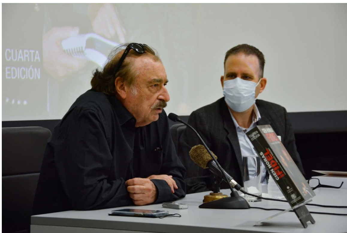
Periodista y catedrático español Ignacio Ramonet.

La Habana, 8 dic (RHC) La nueva edición del libro Cien horas con Fidel se presentó este sábado en La Habana con la presencia de su autor, el periodista y catedrático español Ignacio Ramonet.