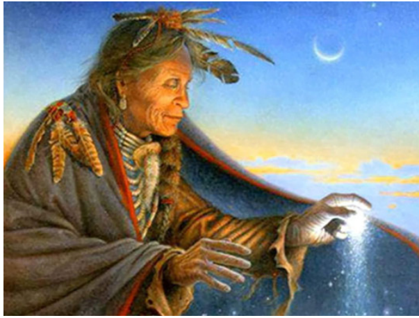
Mabuya el genio del mal

No contaba con Mabuya, el genio del mal, que está en todas partes y a quien hace poca gracia los llantos continuados, inacabables de los niños. Hay que reconocer que tiene motivos para ello, pues solo la paciencia de una madre sufre con resignación la música poco grata del llanto de los hijos.