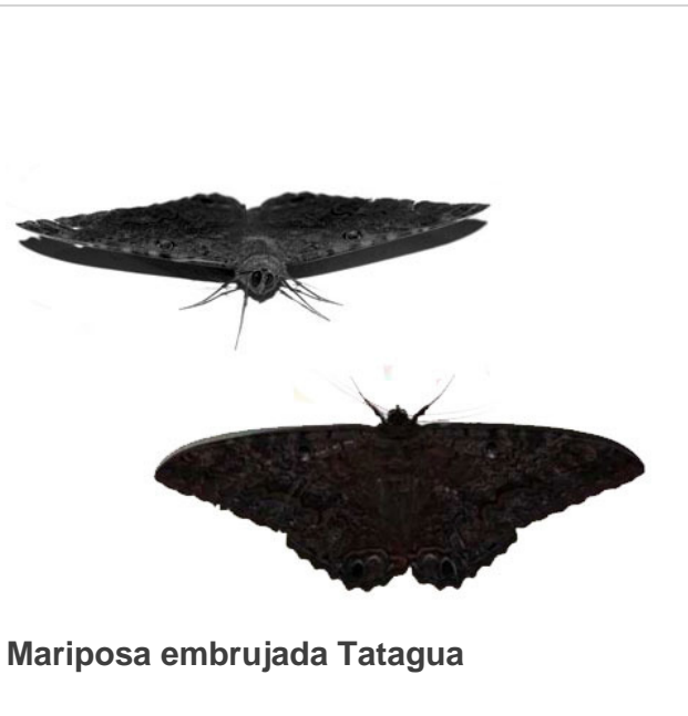
Mariposa embrujada Tatagua

Si el espíritu del mal hubo de castigar en los hijos la falta de su madre, el espíritu del bien, más justiciero, impuso un correctivo a la causante del daño, que debía servir de ejemplo. Transformó a Aipirí en Tatagua, mariposa nocturna de cuerpo grueso y alas cortas, conocida también con el nombre de Bruja.