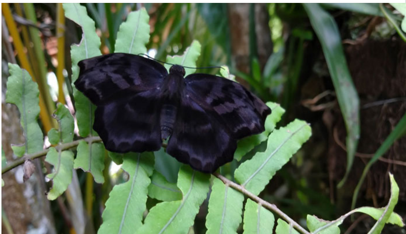
Mariposa negra y la mata de Guao