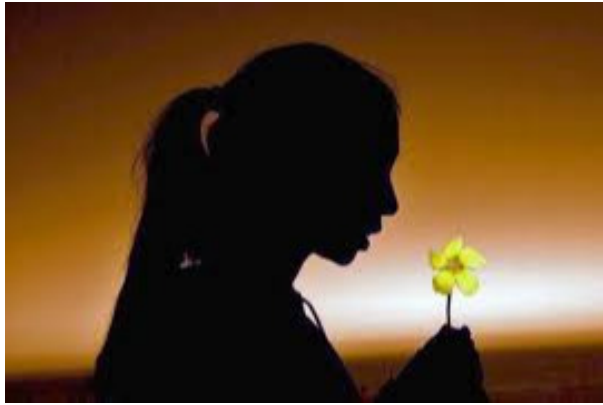
Silueta de Mujer

Requerida de amores por un siboney gran cazador, unió a él sus destinos y hubiera formado un hogar modesto y apacible, pero feliz, si sus aspiraciones se hubieran concretado a las de una mujer hacendosa, amante de su esposo y de sus hijos. Pero Aipirí no se contentaba con eso.