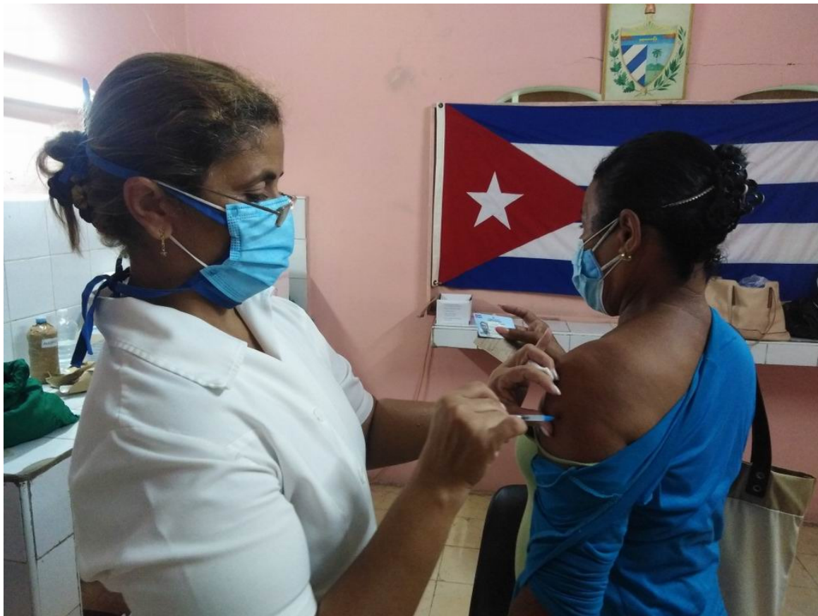
Listas Puerto Padre y Las Tunas para dinamizar la vacunación con el refuerzo