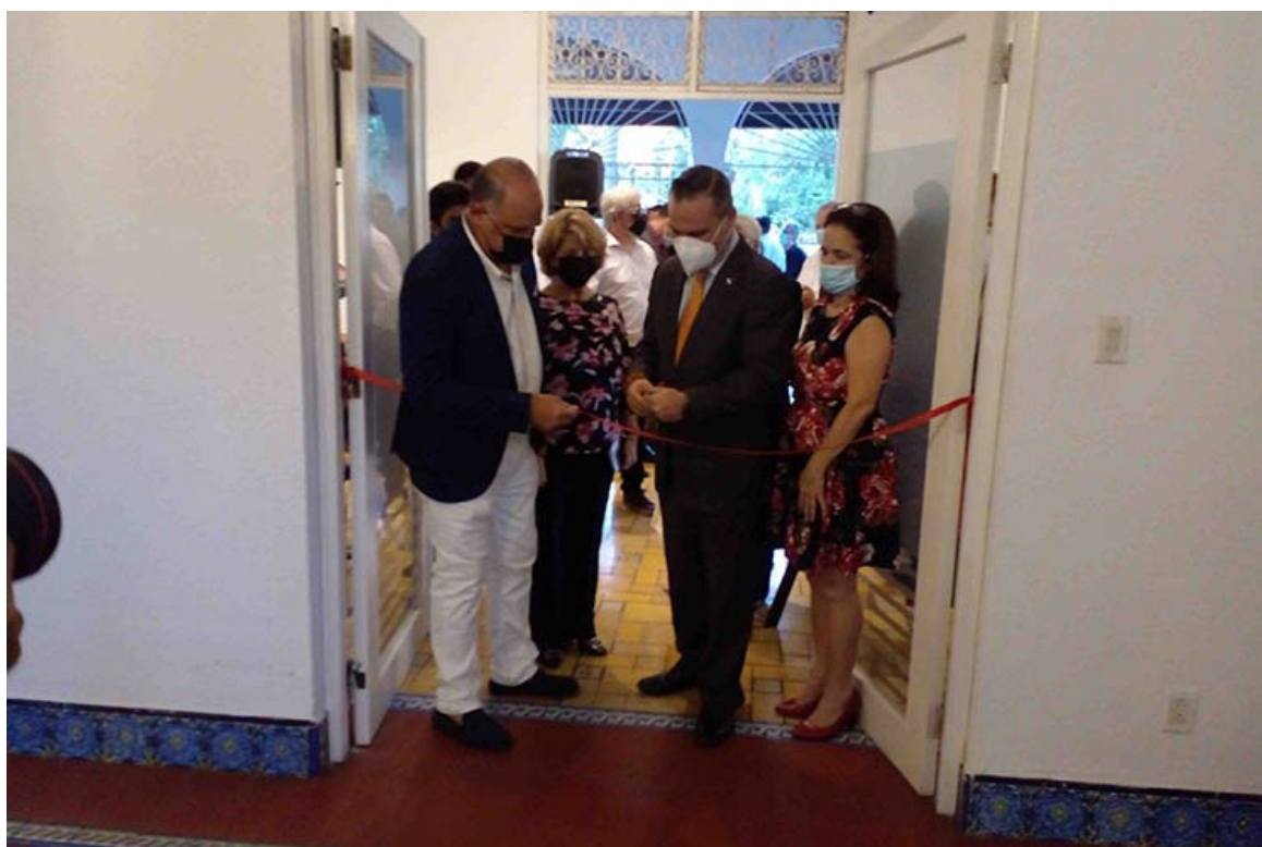
Nueva galería de arte en Panamá saluda triunfo de Revolución cubana

Panamá, 12 ene (RHC) La inauguración de una galería de artes plásticas devino escenario propicio para que residentes cubanos, diplomáticos, autoridades, personalidades y amigos panameños del país caribeño saludaran la Revolución triunfante en 1959.