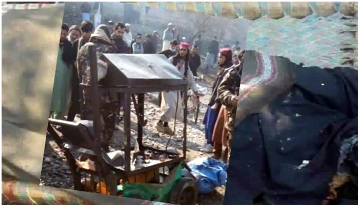
Nueve niños muertos y cuatro heridos en una explosión cerca de una escuela en Afganistán

Afganistán, 12 en (RHC) Al menos nueve niños murieron y otros cuatro resultaron heridos en el este de Afganistán tras explotar por accidente cerca de una escuela uno de los muchos artefactos sin detonar presentes en el país tras décadas de guerra.