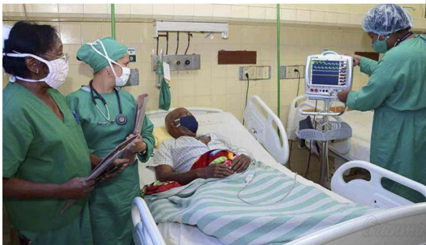
Pacientes de Covid en Cuba

La Habana, 13 enero (RHC) El Ministerio de Salud Pública de Cuba publicó la víspera, nuevos protocolos para el enfrentamiento a la COVID-19 debido al incremento de casos de Covid-19 por la variante Ómicron.