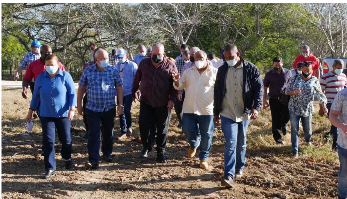
Visita Gubernamental evalúa en Granma planes de desarrollo económico y social

Granma, 13 ene (RHC) Por diseñar un modelo exitoso de producción alimentaria que tenga en el centro al hombre, abogó el primer ministro, Manuel Marrero Cruz, en el bloque productivo Granma 2, un desarrollo de cultivos varios para el autoabastecimiento de los más de 128 mil habitantes del municipio de Manzanillo.