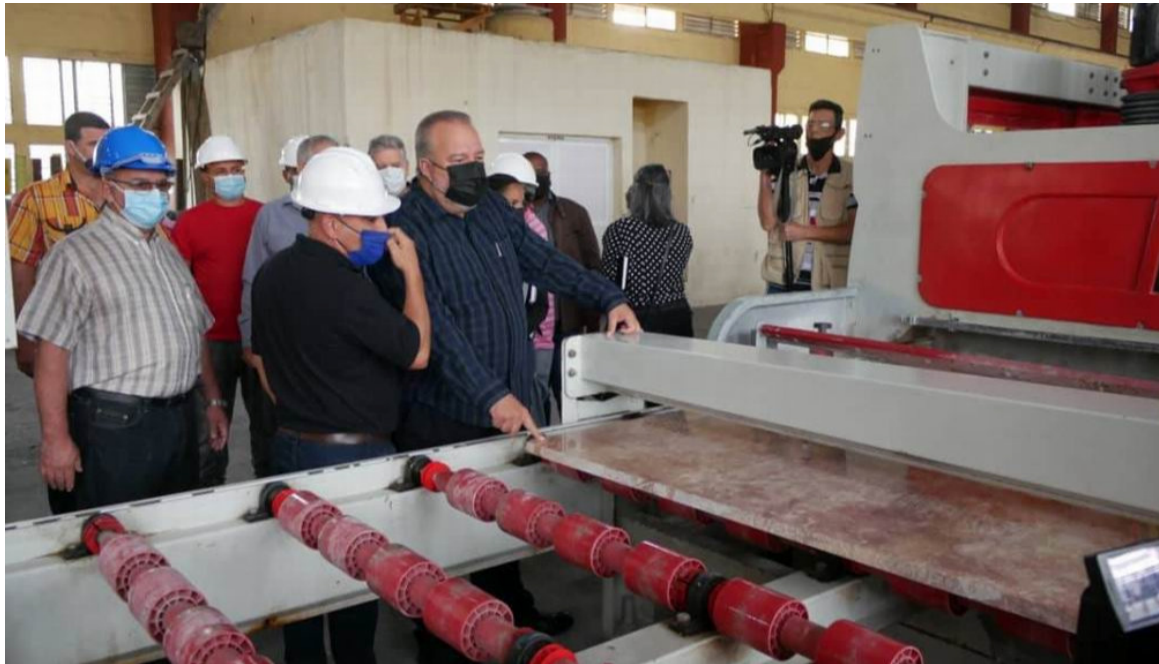
Continúa visita gubernamental en territorio granmense.

Granma, 14 ene (RHC) El primer ministro de Cuba, Manuel Marrero Cruz, inició su jornada de trabajo este viernes en el combinado del mármol de la provincia oriental de Granma, la más grande y moderna industria de su tipo en Cuba.